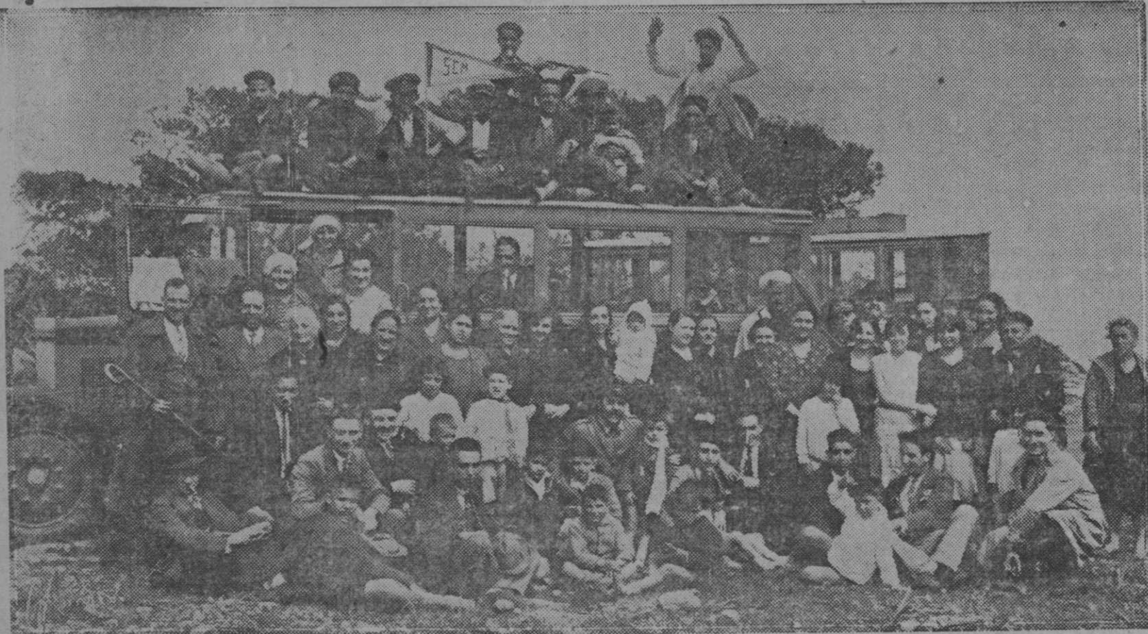
Melilla: Grupo de socios de la Excursionista Melillense, acompañados de sus familias, durante la excursión organizada por dicha Sociedad al cabo de Tres Forcas