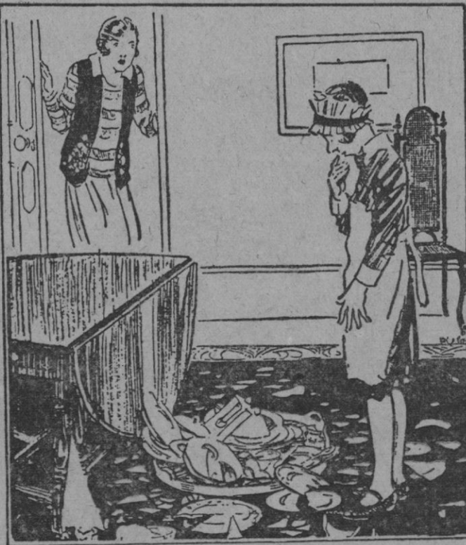
La nueva strivienta (que acaba de tener un pequeño percañes con la mesa plagadiza).—Bueno..., me parece que no está tan mal que haya ocurrido esto. Ahora siquiera sé cómo se maneja...

Un terremoto destruyó la población de villa Atuelo, en la provincia de Mendoza, resultando mas de 50 muertos.