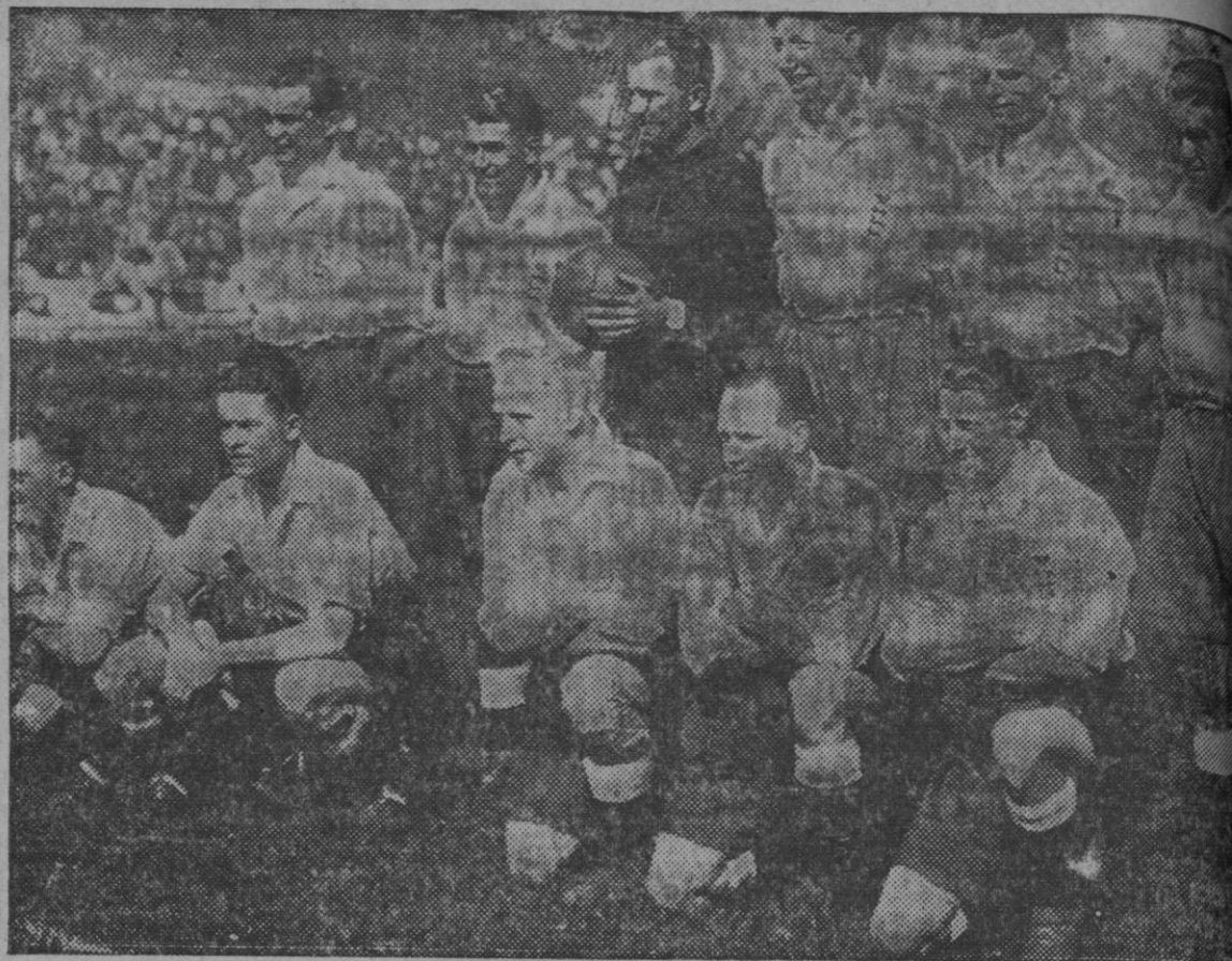
El equipo de selección inglesa profesional que fué vencido en el Stadium Metropolitana por el once nacional español

Madrid 21 a las 22.—Una comisión de Pontevedra solicitó de Guadalupe autorización para establecer un servicio de automóviles en las ferias, romerías y mercados de Galicia.