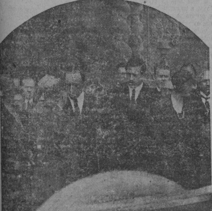
Los Reyes al salir del Palacio de la Reina Victoria Eugenia después de inaugurar la sección de Noruega