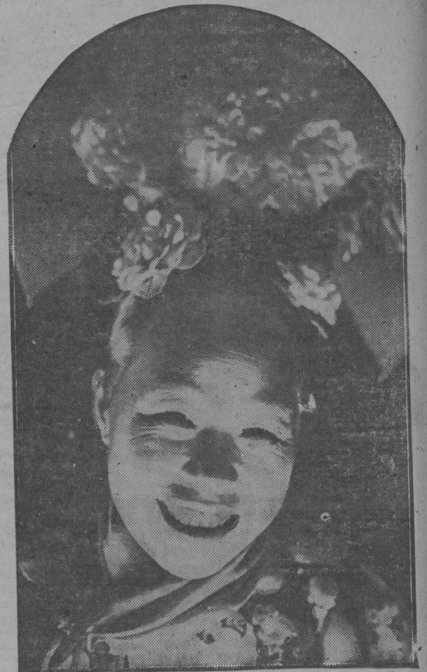
Una típica hermosura de Mongolia