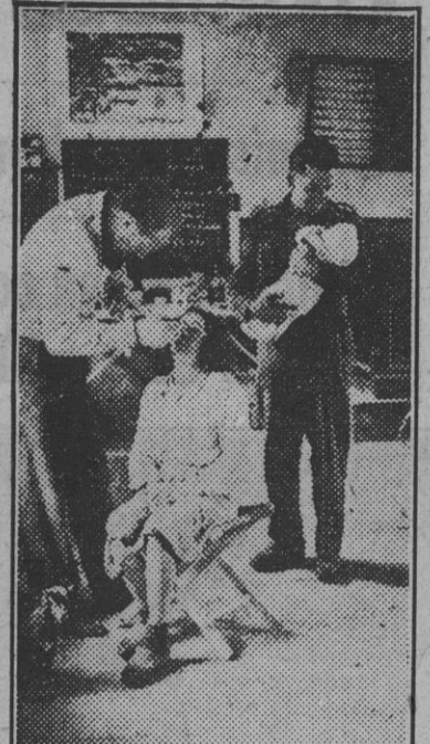
En Caen se ha abierto una clínica para refugiados civiles por el Servicio Sanitario de la R. A. F.