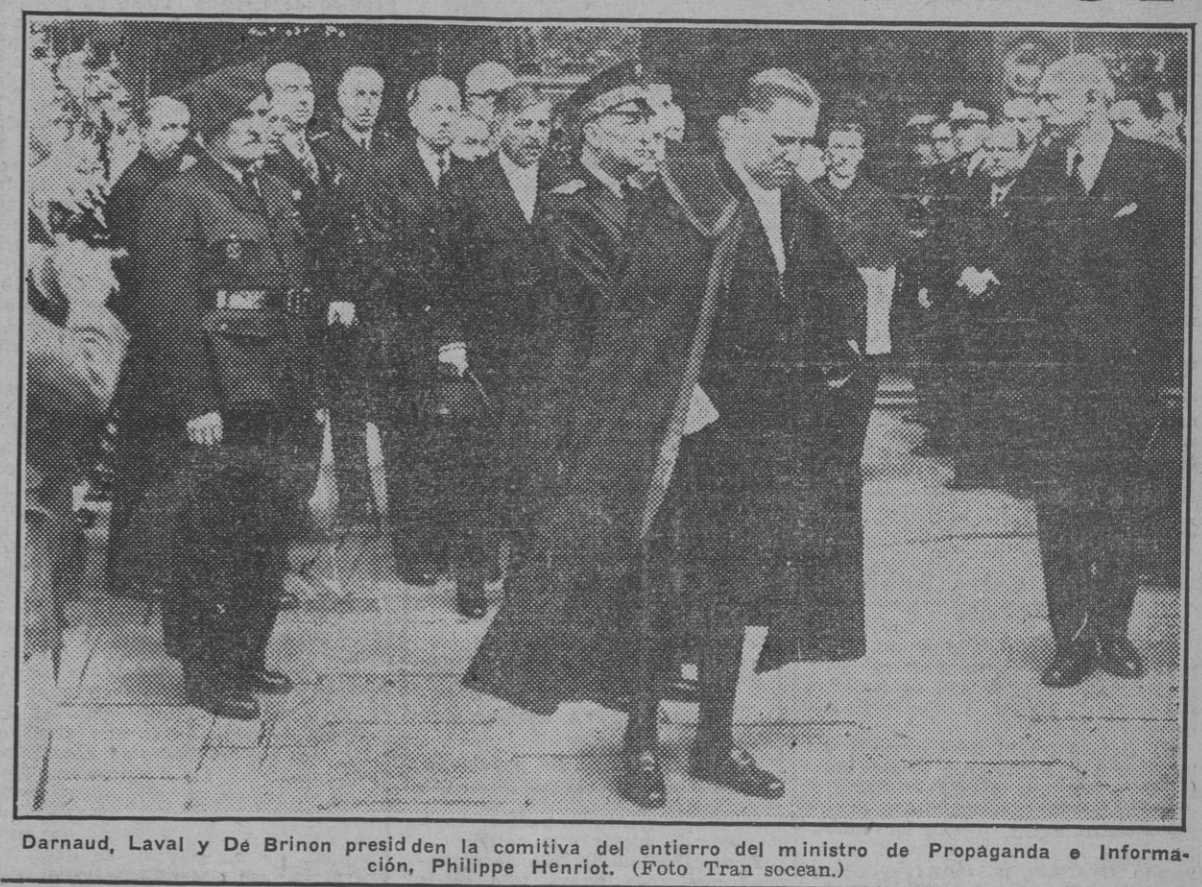
Darnaud, Laval y De Brinon presiden la comitiva del entierro del ministro de Propaganda e Información, Philippe Henriot.