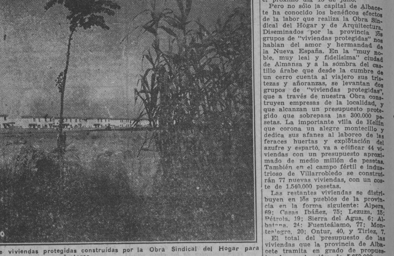
Bella perspectiva del grupo de viviendas protegidas construidas por la Obra Sindical del Hogar para productores.

El importe de su construcción sobrepasa los doce millones de pesetas