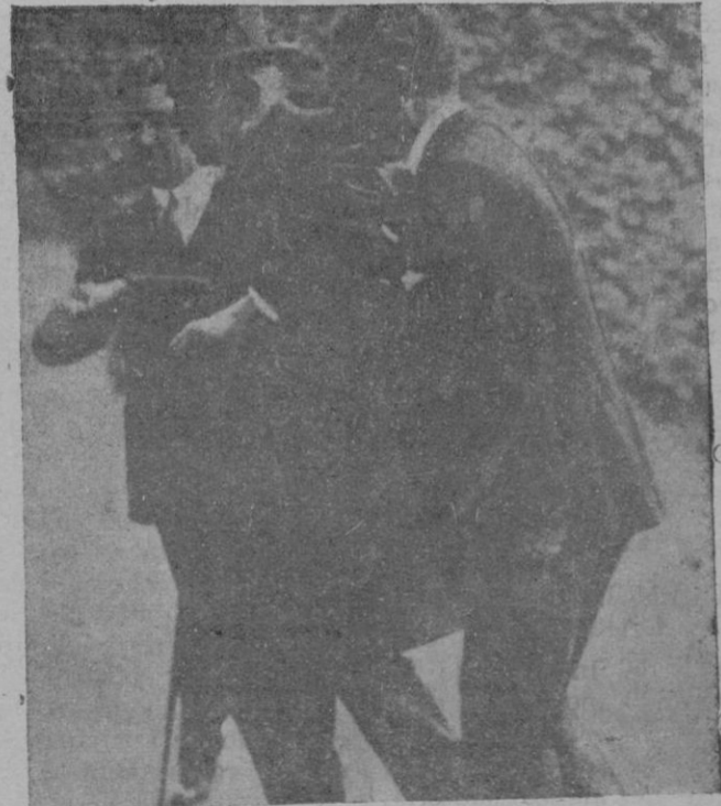
Uno de los últimos retratos del mariscal

la importancia de su fuerza, que les hace más independientes de lo que creen, y se deciden a formar la agrupación sin temor ni amenazas ni coacciones ni miedo al aislamiento, entonces podremos sumarnos circunstancialmente al partido de orden que se forme conservando nuestra personalidad que será respetada y solicitada, y que servirá para ayudar a llevar la actuación Mallorquina por los cauces del orden, de la justicia y la moralidad.