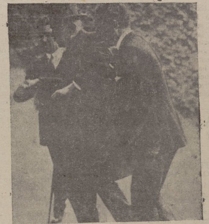
Uno de los últimos retratos del mariscal

la importancia de su fuerza, que les hace más independientes de lo que creen, y se deciden a formar la agrupación sin temor ni amenazas ni coacciones ni miedo al aislamiento, entonces podremos sumarnos circunstancialmente al partido de orden que se forme conservando nuestra personalidad que será respetada y solicitada, y que servirá para ayudar a llevar la actuación Mallorquina por los cauces del orden, de la justicia y la moralidad.