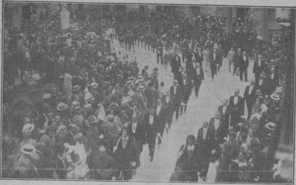
La presidencia de la procesión, al pasar por la plaza de Sta. Eulalia