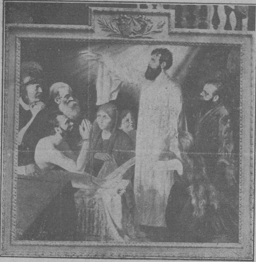
«La resurrección de Lázaro».—Cuadro que la notable pintora húngara ha pintado expofeso y regala a la iglesia del Terreno