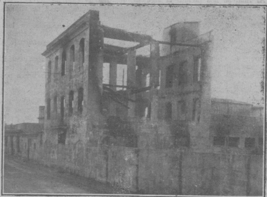
Estado en que quedó la fábrica de calzado del Molinar de Levante, después del incendio

ra al abrigo de las injurias de los hombres. El laurel simbólico y real, podrá crecer en el jardín cultivado por el poeta. La tierra de las Náyades que él cantó, tendrá libre el acceso y será guardada tutejamente por su imagen. La casa angosta en donde el gran poeta vivió, será trasformada en Museo bibliográfico, e iconográfico, consagrado a Petrarca y a Laura. La roca próxima ostentará una inscripción para testimoniar que seiscientos años más tarde el autor del «Canzoniere» vuelve a tomar posesión, para siempre, de aquellos parajes que le fueron doblemente caros, pues que fueron los del amor y los del estudio. El próximo mes de abril cumplirás el sexto centenario de la fecha memorable. Esta fecha será celebrada por Pro-