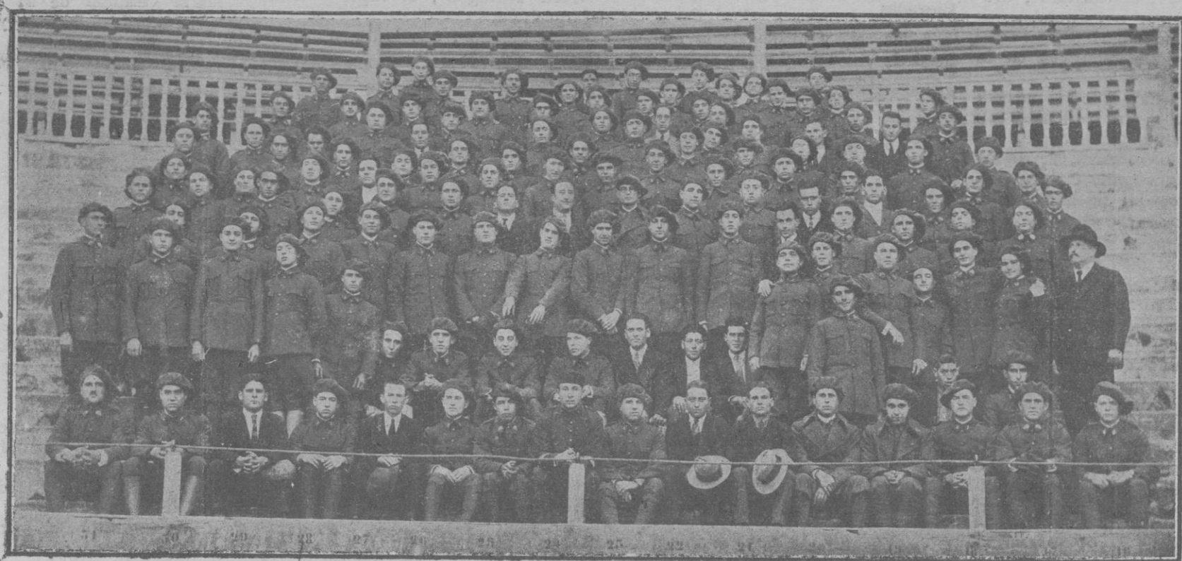
Escuela de Palma. Grupo de alumnos reunidos para presentarse a los Cuerpos a que han sido destinados