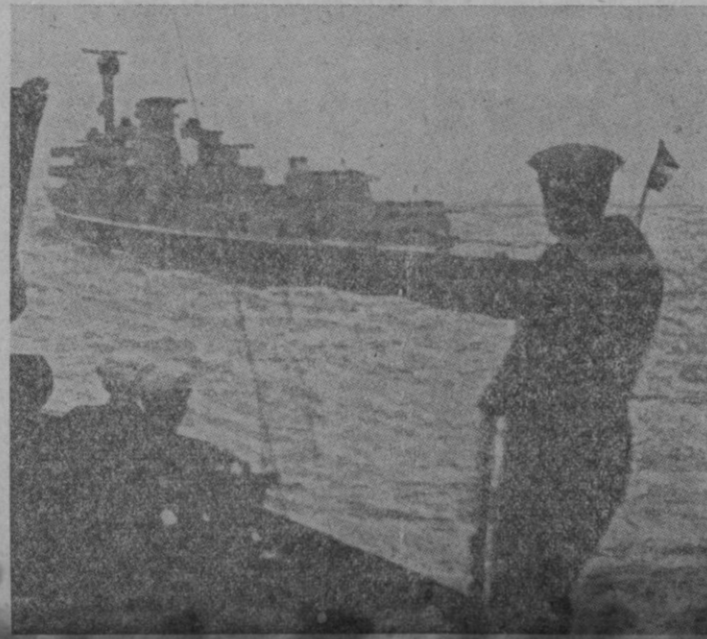
El crucero alemán «Leipzig» que recientemente ha sido objeto de una violenta agresión por parte de los submarinos rojos

enemigo huyó y se le causaron numerosas bajas, cogiéndose muchos muertos, prisioneros y armamento y material diverso. Ejército del Centro: Sin novedades dignas de mención. Ejército del Sur: Frente de Córdoba: En el sector de Espiel ha sido ocupada por nuestras fuerzas el Vértice Puntales. Frente de Extremadura: Fuerzas legionarias ante el propósito del enemigo de atacar Campillo se adelantaron, estableciendo contacto con los rojos a 10 kilómetros de este pueblo, rechazándoles y ocupando los gran número de bajas y ocupando posiciones. Salamanca, 21 de junio de 1937. De orden de S. E.; El General 2.º Jefe de E. M., Francisco Merlín Moreno .