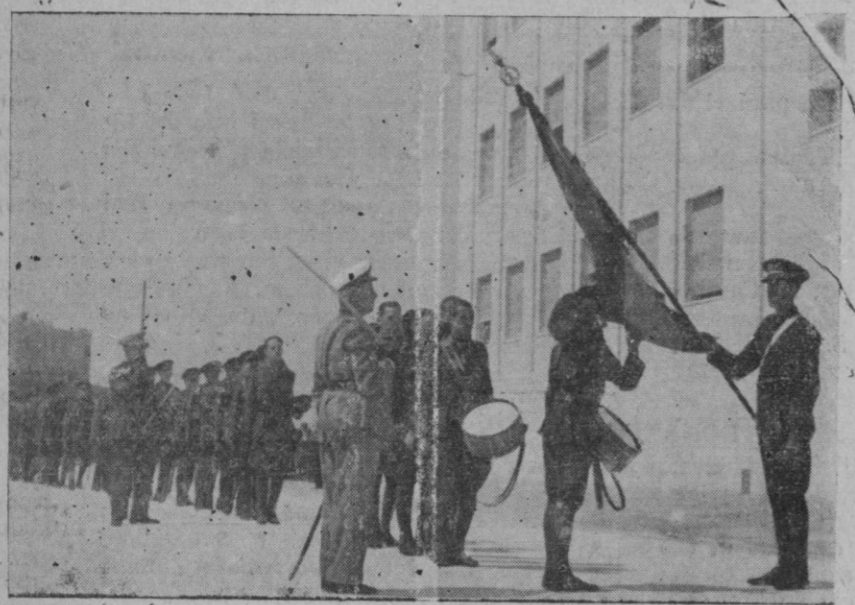
Solemne acto de la Jura de la bandera por los soldados de Infantería de Marina.