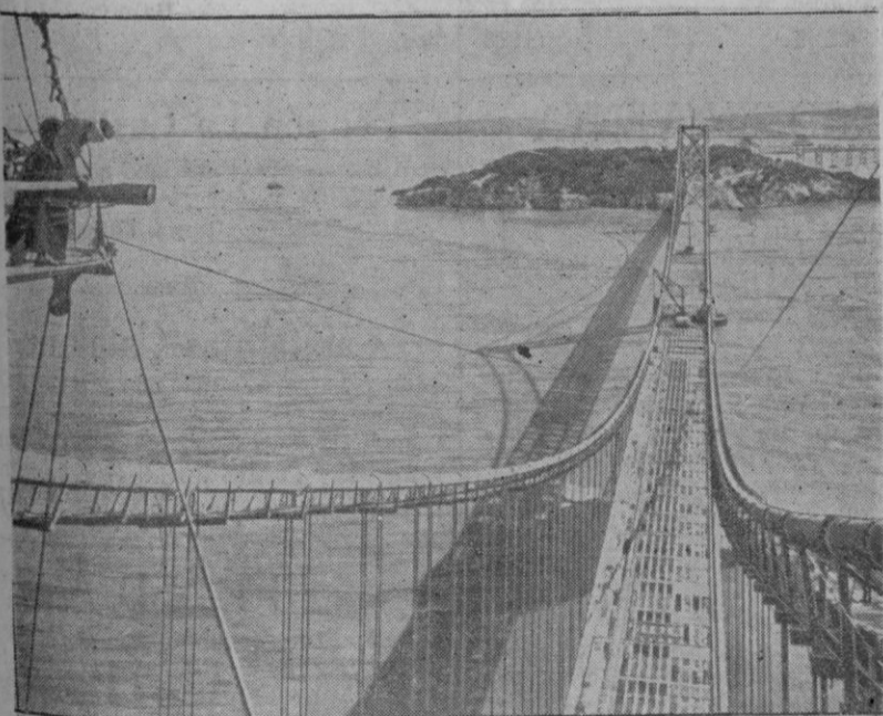
Una vista del puente de San Francisco que es una verdadera maravilla de la técnica. Este puente es el más grande del mundo y en Noviembre próximo será abierto al tráfico.

Pero el Presidente Hoover, patron de los "big business", de la gran industria no podía dejar morir así sin asistencia médica a sus partidarios. Y se creó la Reconstrucción Finance Corporation destinada a prestar a los Bancos y a otras instituciones eco-