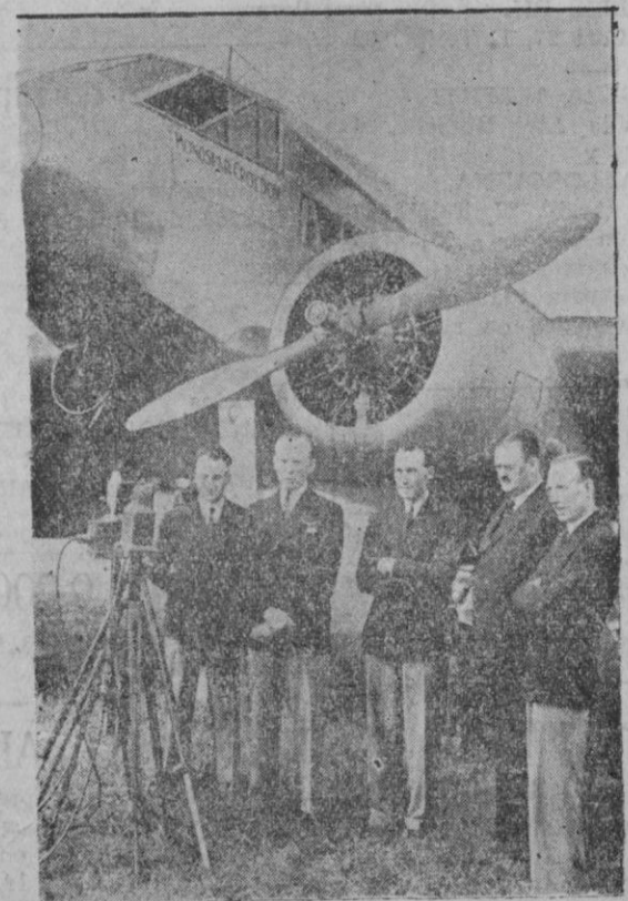
Durante una comida, el ex mariscal del Aire de Inglaterra Lord Sempill ha hecho una apuesta sensacional con un australiano. Según ésta en una semana deberá volar Lord Sempill desde Londres a Melbourne y regreso. Aquí aparece junto al avión con que intentará este sensacional record.