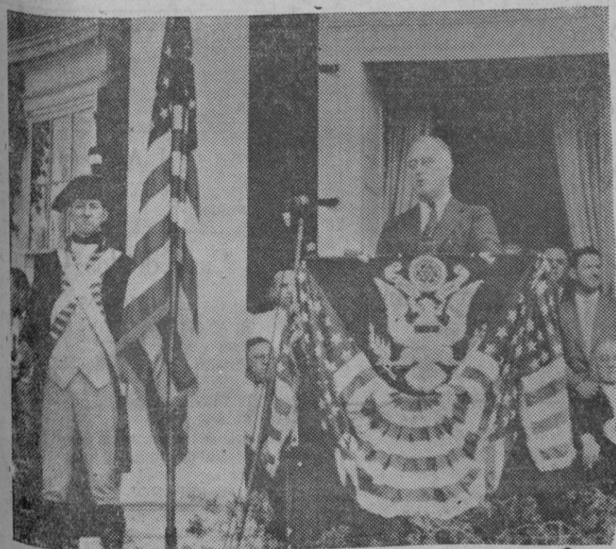
El Presidente de los Estados Unidos Mr. Roosevelt, pronunciando un discurso con motivo de la fiesta del 4 de Julio, conmemorativa de la independencia.