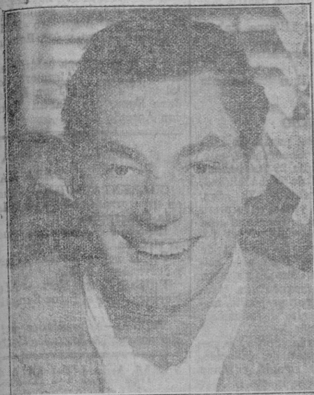
JOHNNY WEISSMULLER, el famoso campeón mundial de natación y protagonista de la película «Tarzán y su compañera» que se estrenará el próximo miércoles en el Lírico