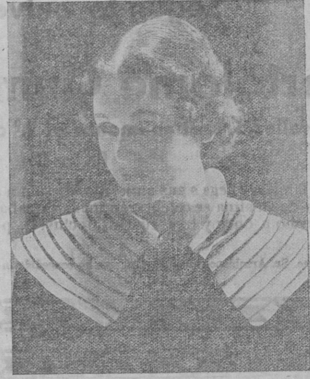
MAUREN O'SULLIVAN que con Johnny Weissmuller protagoniza la famosa película «Tarzán y su compañera»

Quiénes vean esta película, quedarán atónitos de las bellezas de esta producción, y sobre todo de las perfecciones técnicas de que hace alarde, al mostrarlos hechos que parecen absolutamente irrealizables. Todo cuanto digamos en este sentido será pálido reflejo de la realidad. Pero como al fin y al cabo «Tarzán y su compañera» se estrenará dentro de pocos días, el público mismo podrá ser juez en esta cuestión y comprenderá que nuestros elogios todavía quedan pálidos ante la realidad.