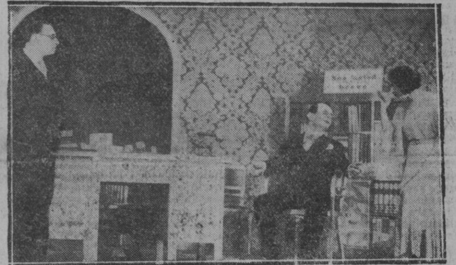
MADRID.—Una escena de la obra "Topacio" estrenada con gran éxito el sábado de Gloria en el teatro Fontalba

(Prohibida rigurosamente la reproducción.)