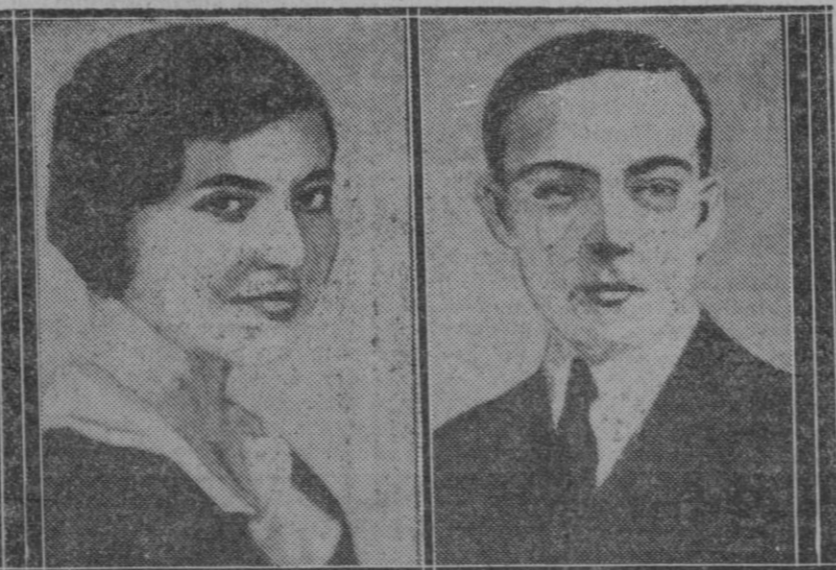
EXTRANJERO.—BODA DE PRINCIPES.—Ayer se celebró en Palermo el enlace del Príncipe Enrique, hijo único del duque de Guisa, con la Princesa Isabel de Orleans-Braganza, hija del Príncipe y de la Princesa Pedro de Orleans-Braganza. Los jóvenes esposos fijarán su residencia en Bruselas

Toda vertiente o pendiente y naturalmente aun más las empinadas, presentan una degradación continua a causa de los desprendimientos, deslizamientos o erosión ocasionados por el agua. Hay que tener en cuenta, además, que las capas superficiales del terreno, disgregadas por la lluvia y ayudado el proceso por las dife-