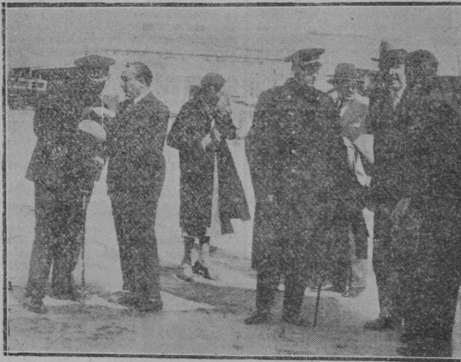
Su Alteza Real el Infante Don Juan emprendió el vuelo desde el Aeródromo de Getafe al de Tablada, en Sevilla, desde cuyo punto siguió el viaje hasta San Fernando para continuar sus estudios en la Academia naval de dicha población. Es el primer viaje realizado por un individuo de la Familia Real

Al recoger en este comentario tal noticia, deseamos que la nueva Junta, atenta a los intereses cuya representación ostenta, actúe con todo entusiasmo en favor de los mismos.