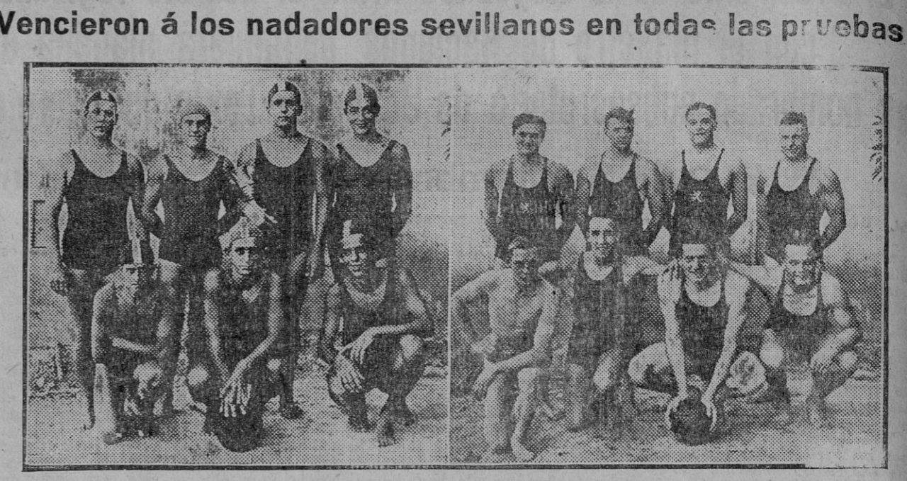
El equipo del Club Natación Sevilla, campeón de Andalucía, y el belga «Dauphins», selección nacional para la Olimpiada en Berlin de 1936, que jugaron anoche un interesante partido de water-polo.

Después de los resultados obtenidos por los magníficos nadadores que componen el equipo nacional belga en los campeonatos mundiales de Mademburgo y últimamente en sus visitas á las piscinas de Barcelona y Madrid, la derrota de los entusiastas muchachos sevillanos era de esperar. No se pretendía eclipsar la clase de los que se encuentran en muy otro momento que los nuestros en cuanto al desarrollo de la natación, sino solamente de ir registrando anotaciones en el valioso libro de las enseñanzas.