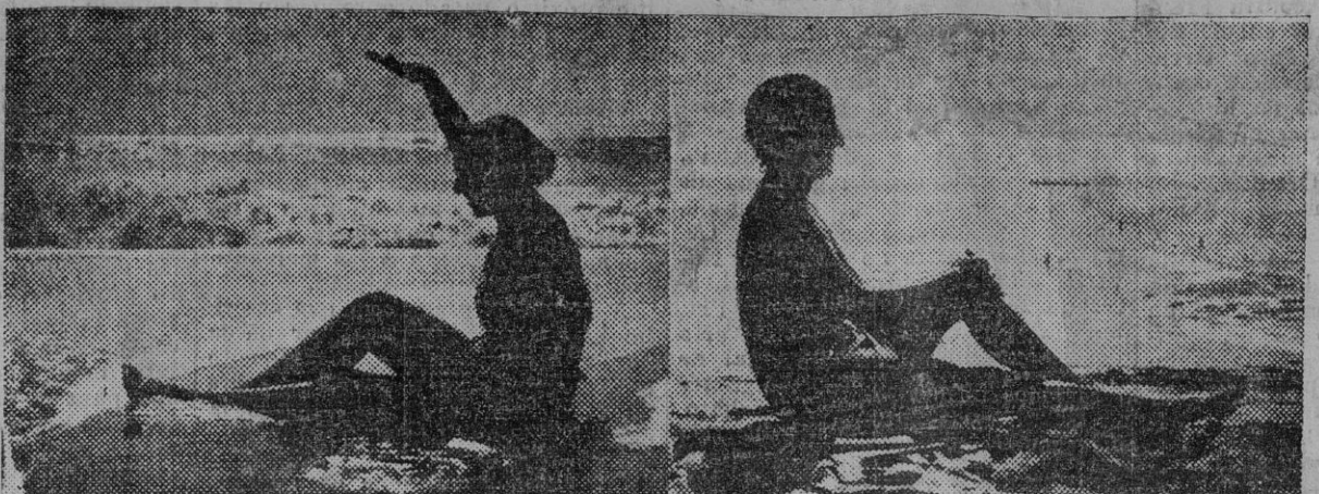
La máquina de un fotógrafo también se siente a veces poeta. El mar y la mujer, eternos inspiradores, han compuesto estos dos magníficos contraluces, obtenidos merced a la pericia y al sentido artístico de un repórter del objetivo.

Washington.—En el report que Richberg, secretario del Consejo nacional de la Presidencia, ha entregado al presidente sobre la N. R. A., se hace constar que la organización ha dado empleo a 4.800.000 parados. Los créditos para trabajos públicos han sido de 3.700 millones de dólares.