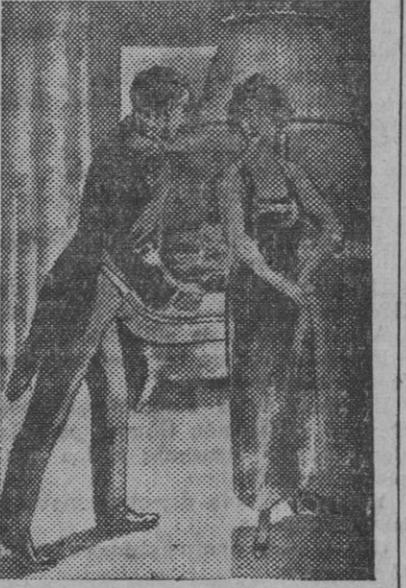
Dame la prueba de cuanto me has dicho... y la prueba...

Diana prorrumpió en una carcajada sarcástica, espantosa de expresión.