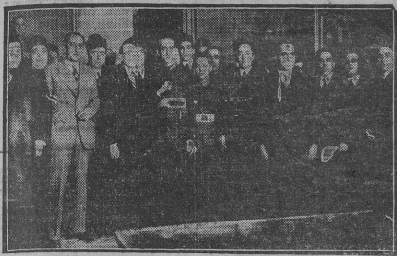
Madrid.—Grupo de procesados por los sucesos del 10 de Agosto en Sevilla, acompañados de sus defensores.

Madrid 23.—Como en el día de ayer, siguen las precauciones adoptadas en los alrededores del Palacio de Justicia.