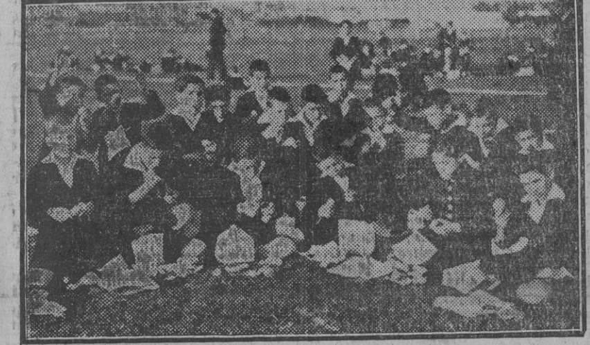
Un grupo de niños durante la merienda con que ayer les obsequió el Aero Club

Del lago, sin manguantes ni crecientos dentro de las riberas contenidas, [tes, están las aguas quietas y dormidas, cansadas del bullicio de las fuentes.