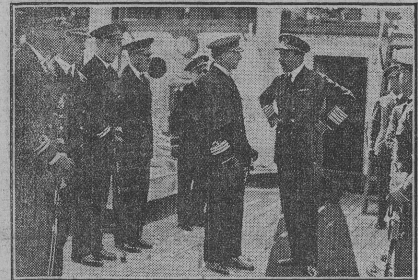
Su Majestad conversando con el comandante del nuevo buque-escuela de guardias marinas «Sebastián Elcaro», durante su visita al mismo.

trada de la compañía de Soria con bandera y música para relevar a la de Ingenieros que prestaba la guardia desde ayer.