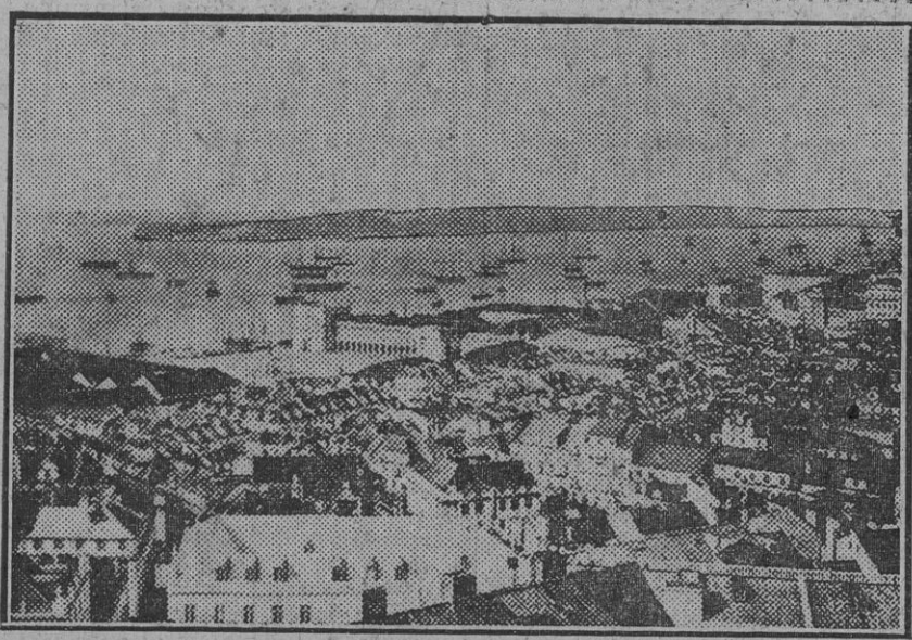
Vista general de Lisboa, donde la situación es muy grave con motivo del movimiento revolucionario.