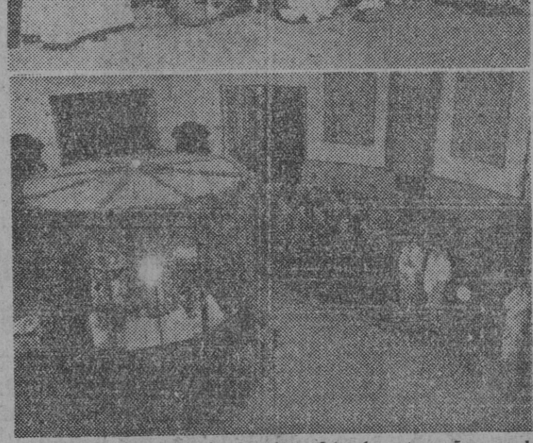
Los emotivos detalles de los festejos celebrados esta mañana en las prisiones Celular y de Mujeres con motivo de la celebración del día de la Merced, Patrona del Cuerpo de Prisiones.

El discurso de Lequerica en Filadelfia, recogido por la Prensa yanqui