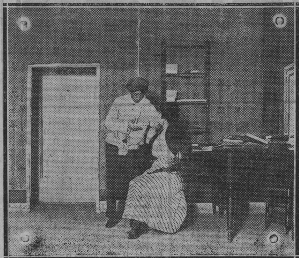
El Sr. Díaz y la Sra. Torres, en una escena de la obra «Hernán Cortés», estrenada en el teatro «Infanta Isabel».

TIP. «SINDICATO DE PUBLICIDAD Barriari, S. Madrid»