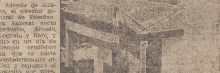
Aspecto parcial del edificio de escuelas inaugurado en Grávalos.

El mismo señor director general de Enseñanza Laboral durante su visita a la Escuela de Trabajo de Logroño.