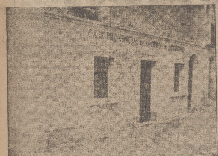
Solemn inauguración de la Agencia de la Caja Provincial de Ahorros de Logroño en Alberite. (Información en tercera plana)