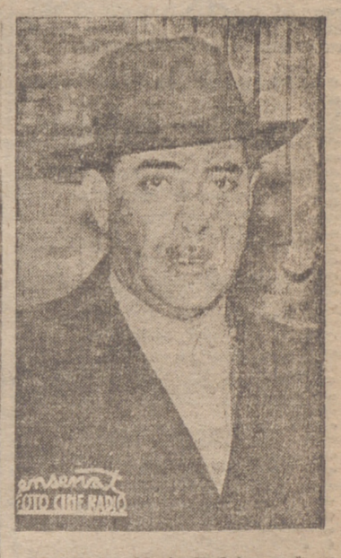
Don Carlos María Rodríguez de Valcárcel

Después de bendecidos los locales por el señor cura párroco, el secretario del Ayuntamiento, pronunció, en nombre de éste, unas palabras de gratitud al señor Rodríguez de Valcárcel y a las autoridades provinciales por su visita. A continuación, el gobernador civil y el director general de Enseñanza Laboral usaron de la palabra para ponderar la importancia de la instrucción en el progreso de los medios rurales y la preocupación que en este aspecto de la política nacional siente el Gobierno y cuantos en los puestos de gobierno del Estado cumplen sus consignas. Los discursos fueron muy aplaudidos. Terminado el acto, el señor Rodríguez de Valcárcel y acompañantes hubieron de regresar por la misma carretera de Alfaro para llegar a Arnedo y Arnedo había quedado interceptada por la nieve, hasta tal punto que un coche en el que se dirigía al citado pueblo de Grávalos una representación de la Diputación para asistir a la inauguración de las escuelas quedó inmobilizado unos dos kilómetros antes de llegar al pueblo por un glació que había formado la ventisca, siendo liberado el vehículo al cabo de casi dos horas de trabajos de los obreros y el cabo jefe de puesto de la Guardia Civil del mismo Grávalos, que accedió a la tercera página.