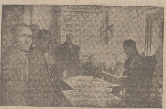
Algunos de los asistentes a la firma de la escritura de préstamo, una vez finalizado el acto.

La Caja de Ahorros de Zaragoza, Aragón y Rioja celebra ahora—añadió el señor Bel—poder dar una nueva muestra de su interés por la agricultura de la Rioja con esta aprobación al Grupo Sindical de Pradejón, y tiene la seguridad de que con ella hace la mejor colaboración a la obra del Instituto Nacional de Colonización y será realidad próxima la conversión en te-