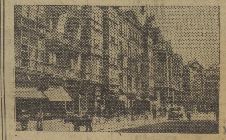
SANTANDER.— CALLE DE AMOS DE ESCALANTE