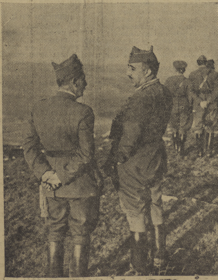
S. E. el GENERALISIMO conversó con el General Dávila en el puesto de mando