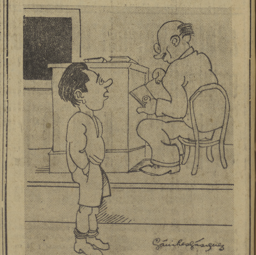
Profesor.—Dígame los temporales que mayor daño causaron en España. —Dos bñidos: Indalecio Prieto y Ossorio y Gallardo.