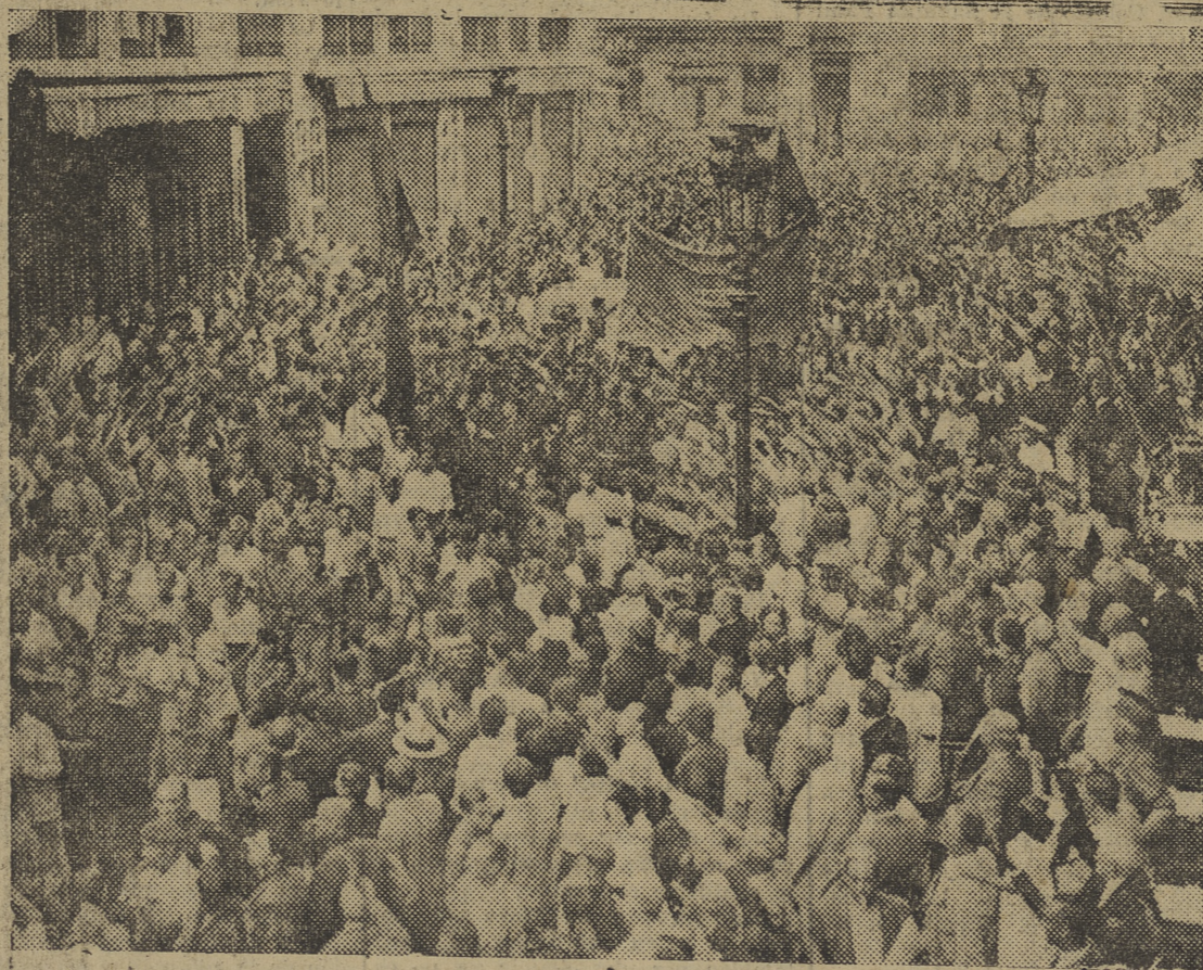
¡Abi está Málaga! Esa masa abigarrada e imponente, es Málaga, que como sabe del dolor de la esclavitud, goza también de la liberación de Santander