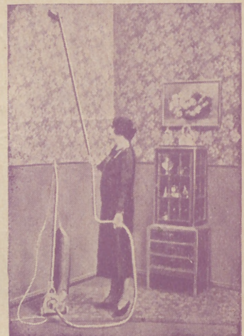
"Dandy" A. E. G. GARANTIZA BRILLO ESPEJO