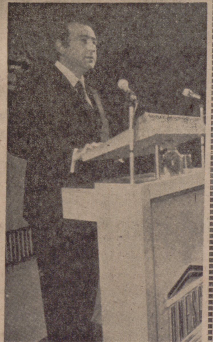
PARIS.—El ministro español de Educación y Ciencias, don Cruz Martínez Esteruelas, durante el discurso pronunciado ayer en la UNESCO con motivo de la XVIII Conferencia Internacional.

“Existe una insuficiencia de Institutos del Estado para el Bachillerato”