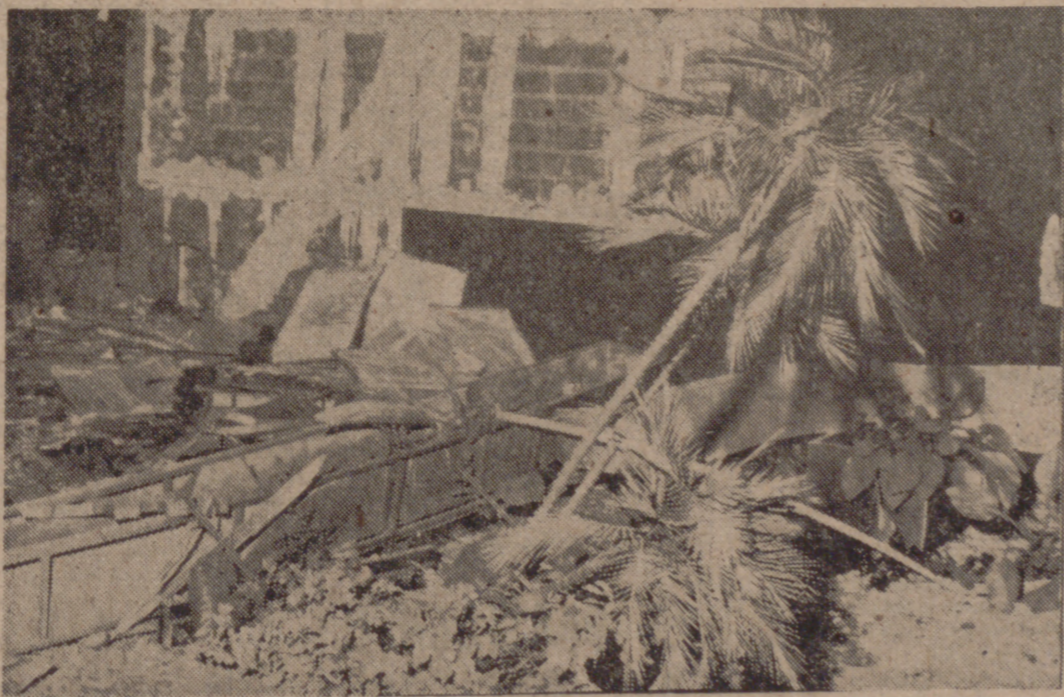
MADRID.—Huellas de los destrozos producidos en el techo y en un lateral de la entrada a la sede del Banco Ibérico, debidos, al parecer, a la explosión de un petardo en la madrugada de ayer. No se registraron víctimas.