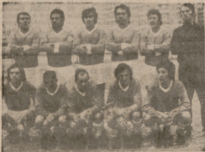
El Circular, que al vencer al At. Arces pasa al primer lugar de su grupo.

En el primer grupo de la Segunda Categoría Regional, después de la jornada del pasado domingo, continúa mandando la clasificación el C. D. Universitario, que no tuvo dificultades para vencer al Rondilla. La victoria del Azor sobre el colista Amjút—el partido fue de intenso dominio del Azor—sirve a éste para escalar varios puestos en la clasificación. De sorpresa puede clasificarse el empate logrado por La Flecha, segundo clasificado, sobre La Antigua; este resul-