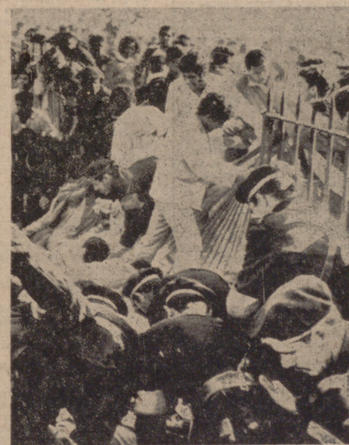
EL CAIRO.—Cuarenta y ocho aficionados murieron y otros tantos resultaron heridos al derrumbarse una tapia del Estadio del Zamalek poco antes de iniciarse el partido entre el citado equipo egipcio y el Dukla Club, de Praga. En la foto, auxilios a las víctimas en las gradas del estadio.