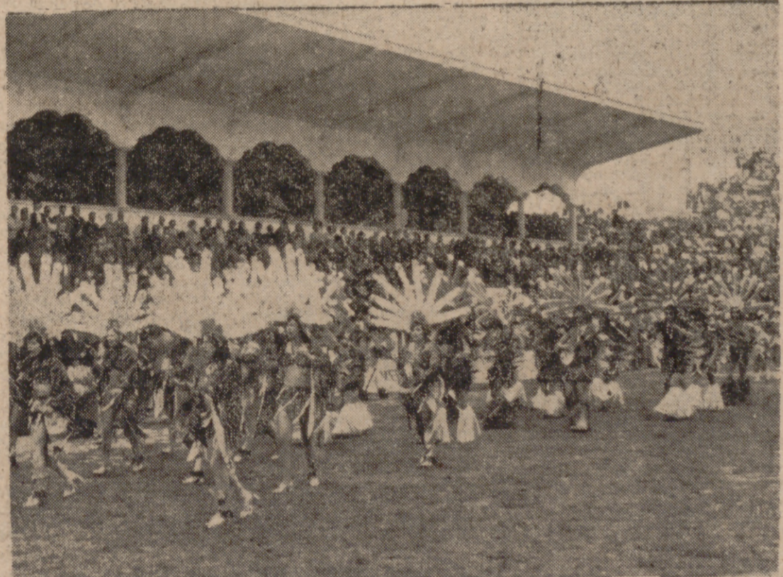
SANTA CRUZ DE TENERIFE.—Al paso de zamba desfilan en el Estadio «Heliodoro Rodríguez López» las comparsas y murgas que participan en las típicas fiestas tinerfeñas de Invierno, herederas de los antiguos carnavales. La exhibición se llevó a cabo antes y en el descanso del partido Tenerife-Burgos. El público quedó muy complacido y psicológicamente preparado para aplaudir luego a su equipo, que ganó por 3-0.