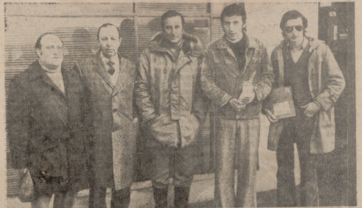
El Primer Teniente de Alcalde de Suances, con el Presidente de la Sociedad y la representación vallisoletana, que conquistó un brillante triunfo.

SUANCES (Santander).—A pesar de la inclemencia del tiempo, veinticinco escopetas representantes de las provincias de Bilbao, Ciudad Real, Santander y Valladolid han participado en la tirada inauguración del Campo de Tiro construido en La Ribera por colaboración entre el Ayuntamiento de esta villa y la Sociedad de Tiro «San Martín de la Arena».