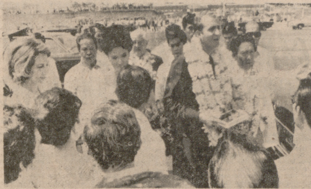
MANILA. — Sus Altezas Reales los Príncipes de España, don Juan Carlos y doña Sofía, llegaron ayer a Manila. En el aeropuerto fueron recibidos por el Presidente Marcos y su esposa. El Príncipe lleva en sus manos la llave de la ciudad, que le fue entregada por el Presidente. Después, don Juan Carlos colocó una corona en el monumento al héroe nacional, José Rizal.

Así, pues, la fortuna continúa sonriendo a los "torres", pero de aquí al 28 de febrero todo podría ocurrir. Los sondeos de opinión están pegando muchos bandazos. El veredicto que otorga ahora las respuestas de los electores depende de muchos considerandos: del día, de la hora, del sexo de las personas encuestadas. Harold Wilson no ha salido tan bien parado como su contrincante de este coque de opiniones entre mujeres. A las inglesas, en política, siempre les gusta arriesgarse menos que a los hombres, por lo que se ve.