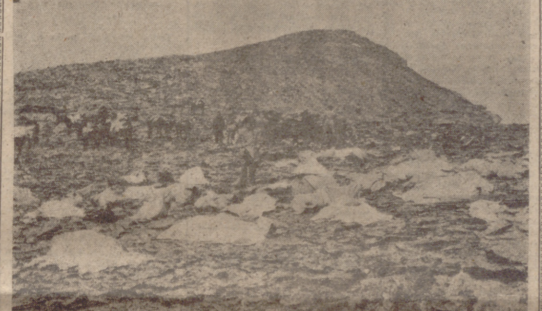
PICO DEL GONERON (Granada).—Foto tomada en el lugar del siniestro durante el rescate de las 80 víctimas habidas al estrellarse un avión "DC-8" de la Compañía francesa UTA, cuando desde Palma de Mallorca se dirigía a Port Etienne (Mauritania). El lugar del accidente ofrecía un desolador aspecto y los trabajos de rescate han resultado muy laboriosos, tanto por lo abrupto del terreno, como por hallarse los cadáveres destrozados y esparcidos en un gran radio de acción. En dichos trabajos han colaborado las fuerzas de la Guardia Civil y Aviación y los habitantes del pueblo de Trévez, que dista del lugar del siniestro unos 30 kilómetros. En la foto, restos de las víctimas tapados con sábanas después de su rescate.