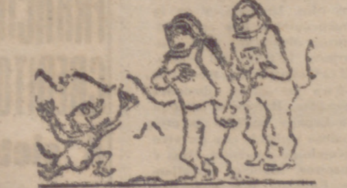
—¡Bienvenidos! ¿Qué queréis tomar, whisky o vodka?

(SOLUCION AL CRUCIGRAMA EN LA SECCION DE ANUNCIOS ECONOMICOS)