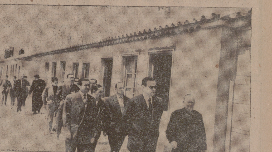
Visitando las nuevas viviendas.

También se interesó por los proyectos de reconstrucción del castillo