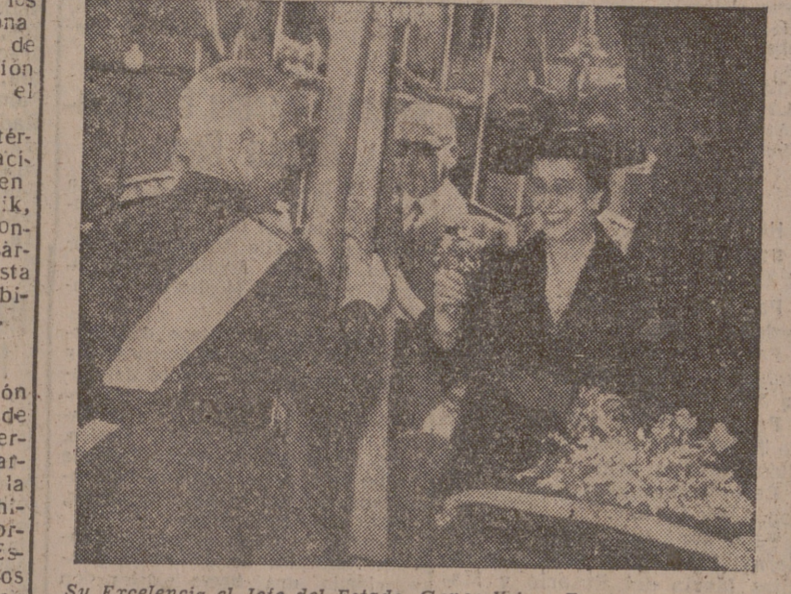
Su Excelencia el Jefe del Estado, Generalísimo Franco, y su esposa entregan la bandera a la Academia del Cuerpo de la Guardia Civil. La esposa de S. E. el Jefe del Estado, Generalísima Franco, en el acto de hacer entrega de la bandera, de la que es madrina, al General Jefe de la Guardia Civil.