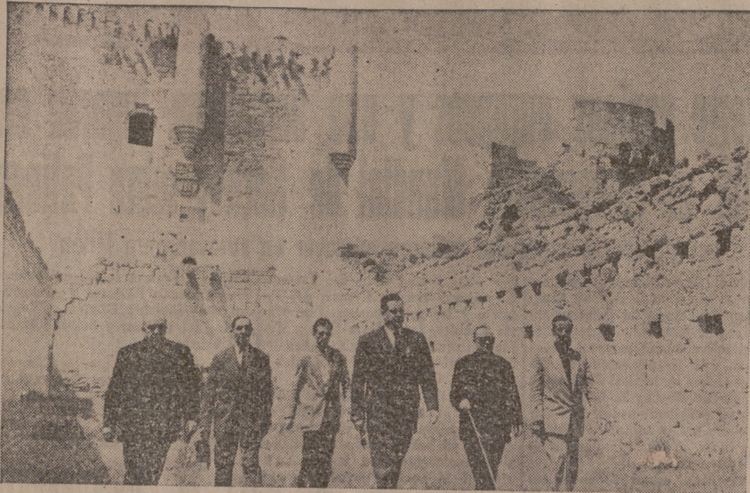
El camarada Aramburu visita do el Castillo de Peñafiel.