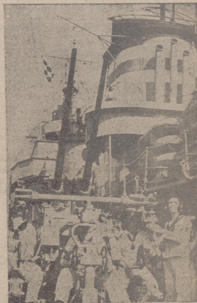
Por el Océano Atlántico, entre Cádiz y Canarias, la Escuadra española ha realizado sus maniobras de otoño. Cuarenta y cinco unidades de diversos tipos, con aviación auxiliar, han participado en el supuesto táctico naval, que es el de más envergadura que se ha hecho desde hace veinticinco años. En la fotografía, una de las piezas antiaéreas del crucero "Miguel de Cervantes", captada durante las maniobras, que concluyeron ayer.