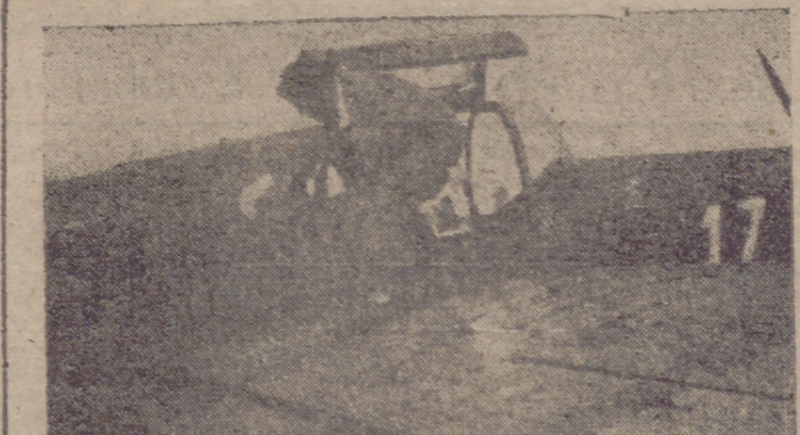
Una de las participantes al llegar a nuestro aeródromo (INFORMACION EN LA PAGINA QUINTA.)