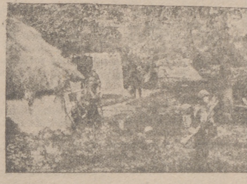
Infantería germana en una granja soviética