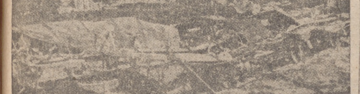
Una estación soviética destruida por los Stukas

Los necios pacifistas y los tópicos del desarme pueden trabajar en impotencia, y los imperios que hoy proclaman su deseo de desarmar a otros pueblos fuertes y enteros terminarían, si pudiesen ver cumplidos sus deseos, actuando de cabos de varas frente a los débiles, que en su debilidad e indiferencia encuentran su ruina y su miseria.