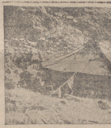
Campamento de cazadores alpinos alemanes en el Norte de Rusia

Simla, 26.—Comunicado oficial de las fuerzas británicas en el Irán: "Las fuerzas británicas e hindúes han penetrado en el Irán por tres puntos en las primeras horas de la mañana del lunes. La cooperación naval y aérea ha permitido el desembarco de fuerzas en Abadán, y un pequeño destacamento hindú ha ocupado Bandarshahpur, donde se encontraban dos barcos alemanes averiados, tres italianos con ligeras averías y otros dos barcos, alemanes que se encontraban en dique seco. Sus tripulaciones han sido capturadas.