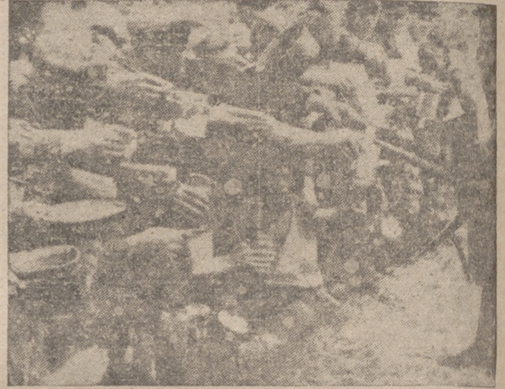
En un campo de concentración del frente oriental.—A los prisioneros rusos, después de una larga marcha, se les da tiempo para saciar su sed

En el sector central del frente, la importante línea Snovsk-Knontop-Loov ha quedado destruida por los eficaces bombardeos.