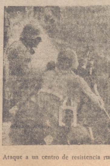
Ataque a un centro de resistencia rusa en Ucrania

La Paz, 26.—El semanario "Estampa" publica, bajo el título de "Imperio de la América del Norte", un mapa en el que se representa al mundo con la zona de influencia de los Estados Unidos. Según el semanario brasileño, esta influencia se extiende a todo el continente americano, a Inglaterra, Irlanda, Australia y a tres grandes partes de Asia y Africa.