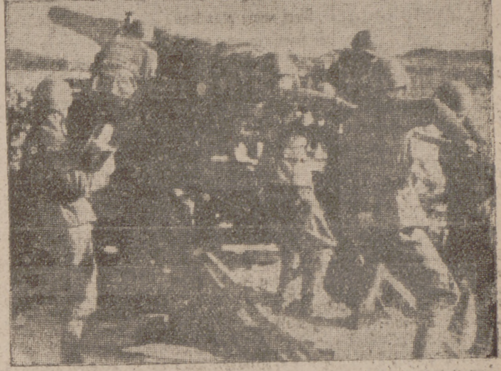
Artillería italiana de medio calibre durante una acción de ametrallamiento de las posiciones enemigas en el frente griego

El "12 Uhr Blatt" dice, refiriéndose al embarque de tropas inglesas, que "es un espectáculo de lo más desagradable que jamás vió la Historia. La cuenta moral de la Gran Bretaña, demasiado recargada ya por sus contradicciones e informaciones falaces, recibirá el golpe de gracia en este segundo Dunquerque. Después de esta retirada, el mundo conocerá de nuevo—y de una vez para siempre—la falta de escrúpulos y veracidad, que son cualidades esenciales de la Gran Bretaña, y se demostrará también que cualquier país que en ella deposite su confianza se verá traicionado y vendido".—Efe.