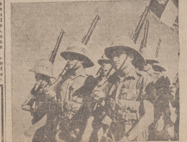
Soldados de De Gaulle en Africa

Madrid, 15.—Por disposición del Ministerio de Educación Nacional las clases en Madrid se reanudarán el próximo lunes, día 21.—Cifra.