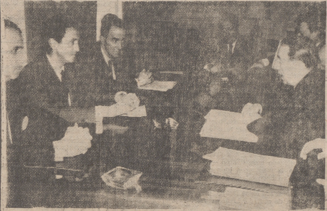
Una de las entrevistas entre López Bravo y Marcellin. — (Foto "Fiel").

Ventajas de actuación conjunta con vistas a terceros países (Comunicado conjunto tras las conversaciones López Bravo - Marcellin) El ministro francés fue recibido por el Caudillo