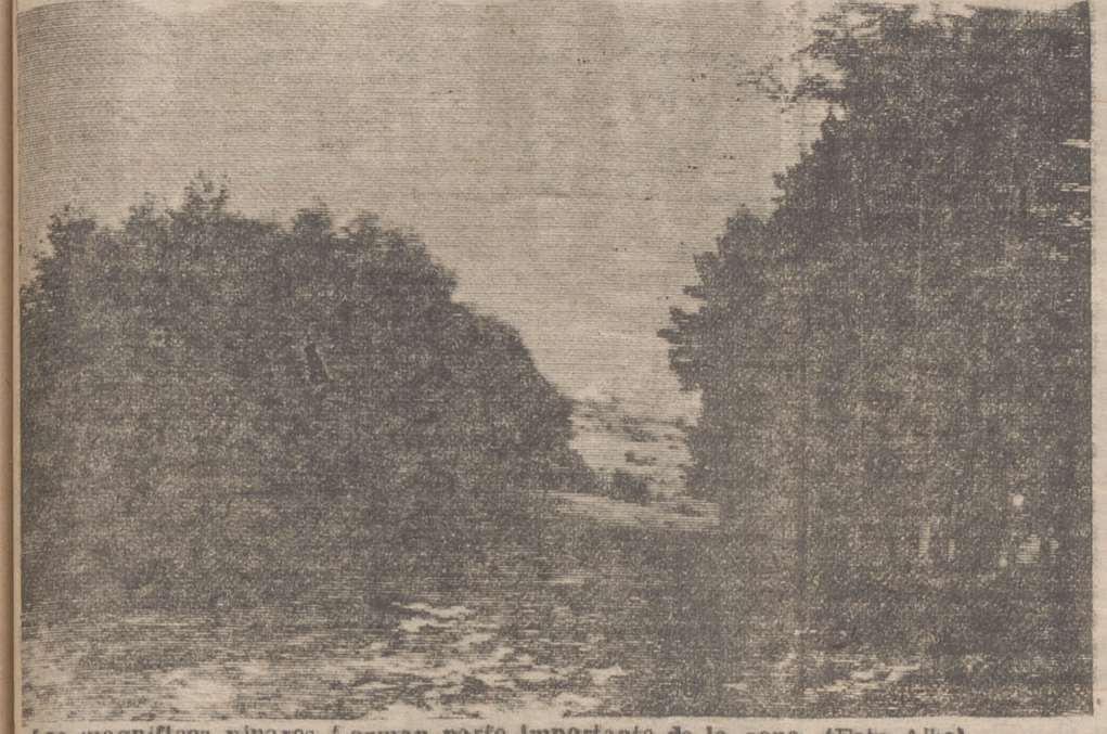
Los magníficos pinares forman parte importante de la zona (Foto Albe).

El proyecto comprende un hotel de primera A, cuatrocientos chalets, apartamentos e instalaciones deportivas