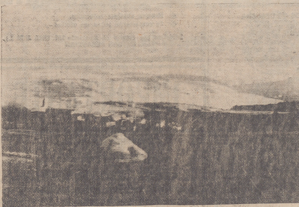
En El Rasillo, bonito halcón riojano sobre el embalse de González Lacasa, se proyecta construir una ciudad residencial. (Información en página siete)