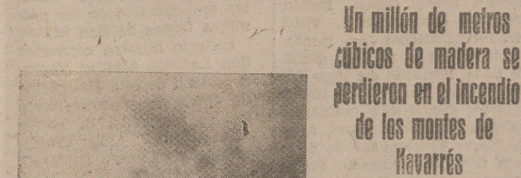
Un millón de metros cúbicos de madera se perdieron en el incendio de los montes de Navarrés