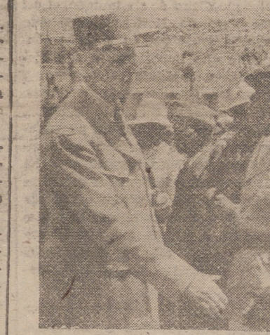
Primera foto del viaje del general De Gaulle, el cual será de un recorrido de 19.000 kilómetros. Aquí le vemos en su primera etapa saludando a los jefes del interior del Africa Negra.

TANANARIVE (Madagascar), 23.—El general De Gaulle ha conseguido su primera victoria en la lucha entablada para mantener los territorios franceses de ultramar unidos a la metrópoli. Esta es la opinión expresada por fuentes competentes de Madagascar, que afirman que el jefe del Gobierno francés, después de un día de estancia en Tanarive, lleva consigo un acuerdo por el que Madagascar continuará perteneciendo a la Unión Francesa.