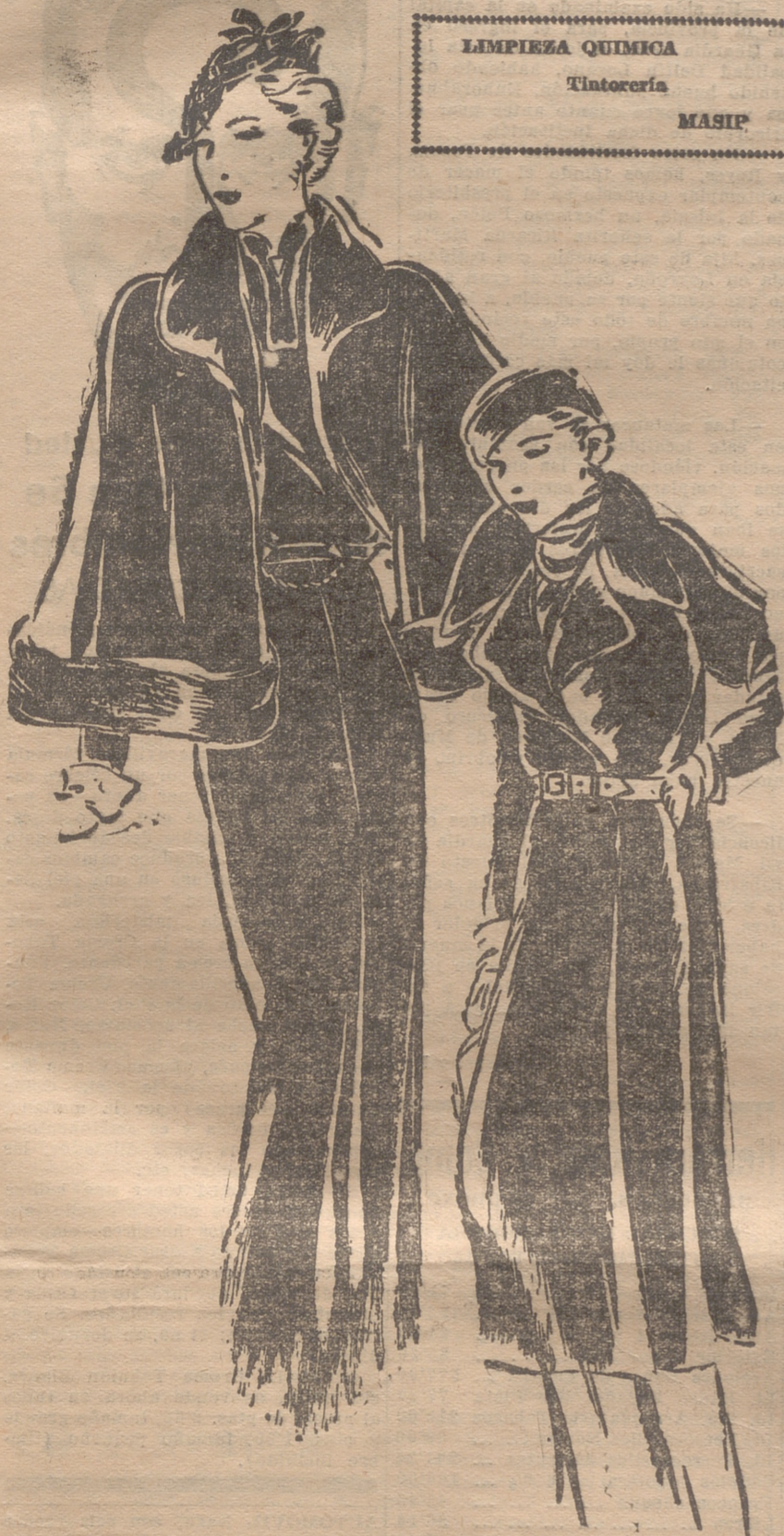
Vestido de angorina negra, con capa postiza y adornada con piel de lince. El beret de antilope negro, adornado con abalorios. — Conjunto de castor natural, toca rusa y abrigo tres cuartos. Cinturón de cuero rojo.