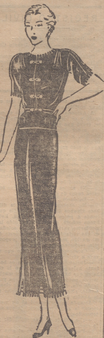
Vestido muy práctico, de casha negra, dentado en los extremos y adornado con botones de jade