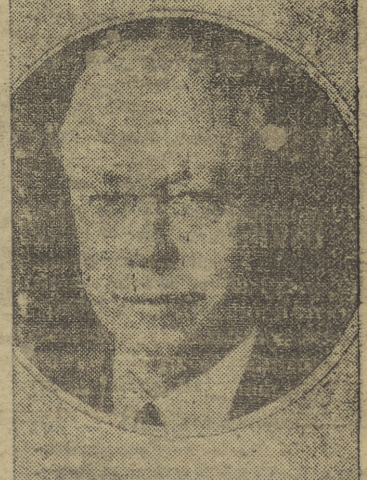
Taft nació el 8 de septiembre de 1859. Su padre era entonces el 26 presidente de EE. UU. Su abuelo había sido secretario de Guerra. Se dedicó desde joven a la política, siendo el hombre más representativo del partido republicano, de cuya minoría era jefe en el Senado. Se presentó tres veces candidato a la presidencia.

NUEVA YORK, 31. — El Hospital de Nueva York ha facilitado el siguiente comunicado: "La vida del senador Taft se extinguió placidamente, sin dolor, a las 11, 30 de la mañana -cuatro y media de la tarde, hora española- del 31 de Julio de 1953, a consecuencia de una enfermedad de cáncer, difícilmente diagnosticable.