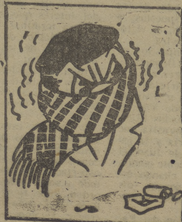
"La ley del Norte"