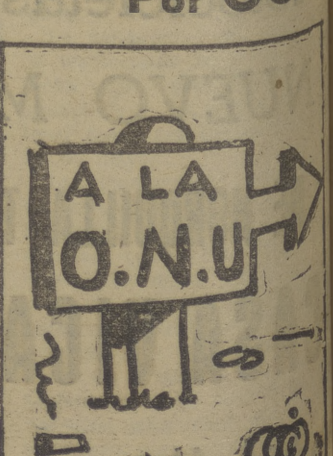
"Camino de Babel"