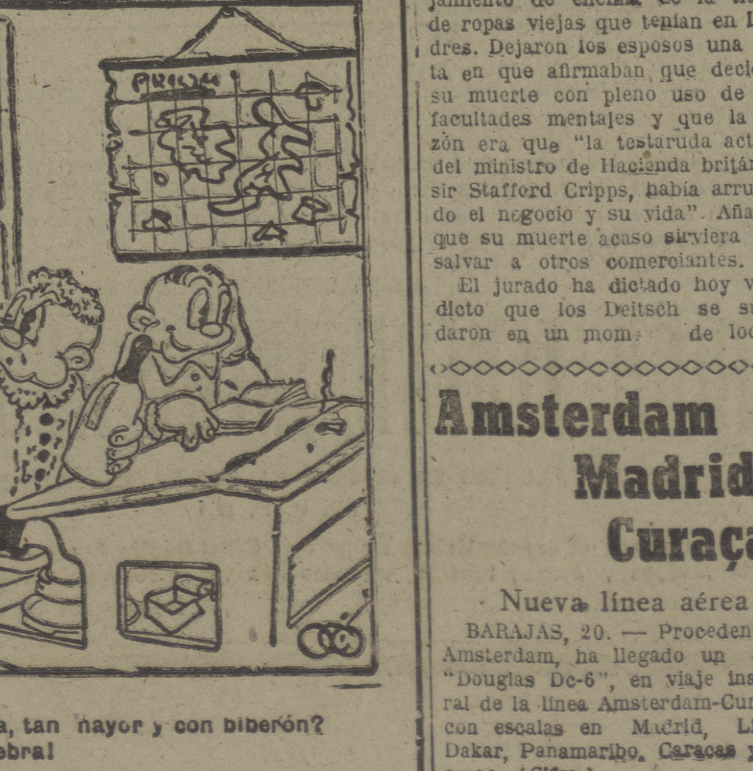
—¿No te da vergüenza, tan mayor y con biberón? —¡Chiss...! ¡Es ginebral!