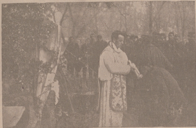
Adoración del Niño-Dios en el frente