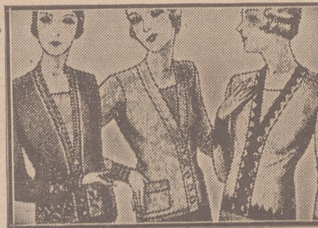
Blusas chaquetillas de 7, 8, 10, 12 y 15 ptas.