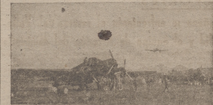
En los campos de aviación de Albania: Un gran trimotor italiano de bombardeo regresa de una acción ofensiva, mientras en el aeródromo se efectúa el abastecimiento de otros aparatos.

Como por la guerra es difícil prevenir los fenómenos meteorológicos que determinan los cambios de temperaturas, el primer punto de observación es San Sebastián, y en esta ciudad se ha registrado esta tarde un nuevo descenso de un grado; se registraron nueve grados, ayer siete, y hoy seis. El mismo descenso se ha producido en la mitad del Norte de España