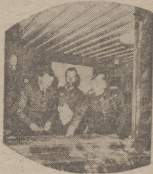
Hitler, con su Estado Mayor, estudiando sobre un plano las rutas de la aviación alemana en sus ataques contra Inglaterra.

La aviación alemana prosiguió, en el curso de la noche del 28 de noviembre y el día de la misma fecha, sus ataques de represalia contra los objetivos militares en la región londinense. Se comprobaron nuevos incendios y explosiones. Fuerzas muy considerables atacaron en la noche del 28 de noviembre la ciudad y las instalaciones portuarias de Plymouth. El intento ataque originó (Pasa a la cuarta página)