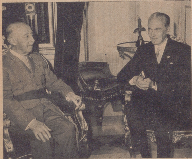
MADRID.— En el Palacio del Pardo, Su Excelencia el Jefe del Estado, Generalísimo Franco, ha recibido al Ministro francés del Plan de Desarrollo Sr. Rene Bettencourt.

Darfa para cultivar a medias pequeño huerto, con frutales, en la carretera de Logroño, próximo "El Cachirulo", con agua propia. Dirigirse Telef: 21 69 83