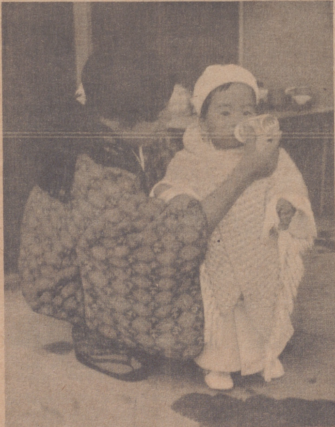
SANTA INFANCIA OBRA MISIONAL PONTIFICIA

No seas indiferente, tu oración, tu donación, para evangelizar, sanar, a los niños de las gentes