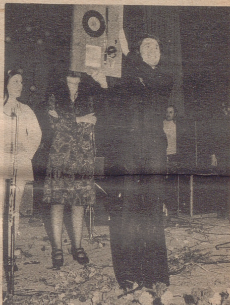
BARCELONA.— El popular cantante Raphael muestra la placa acreditativa del premio "Ole de la Canción" que ha recibido por el conjunto de su labor como cantante en el transcurso del pasado año.