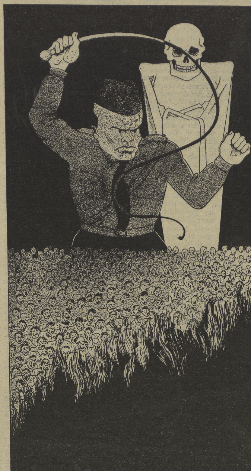
Mussolini provoca el incendio de la Humanidad