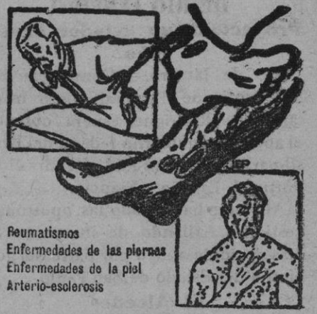
Rumatismos Enfermedades de las piernas Enfermedades de la piel Arterio-esclerosis