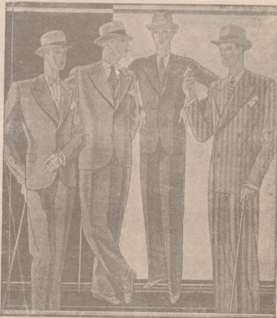
Trojes paño novedad desde 40 a 150 pesetas. — Corte moderno.

Para informes en las oficinas de la Compañía: PLAZA DE MEDINACELI, 8 BARCELONA