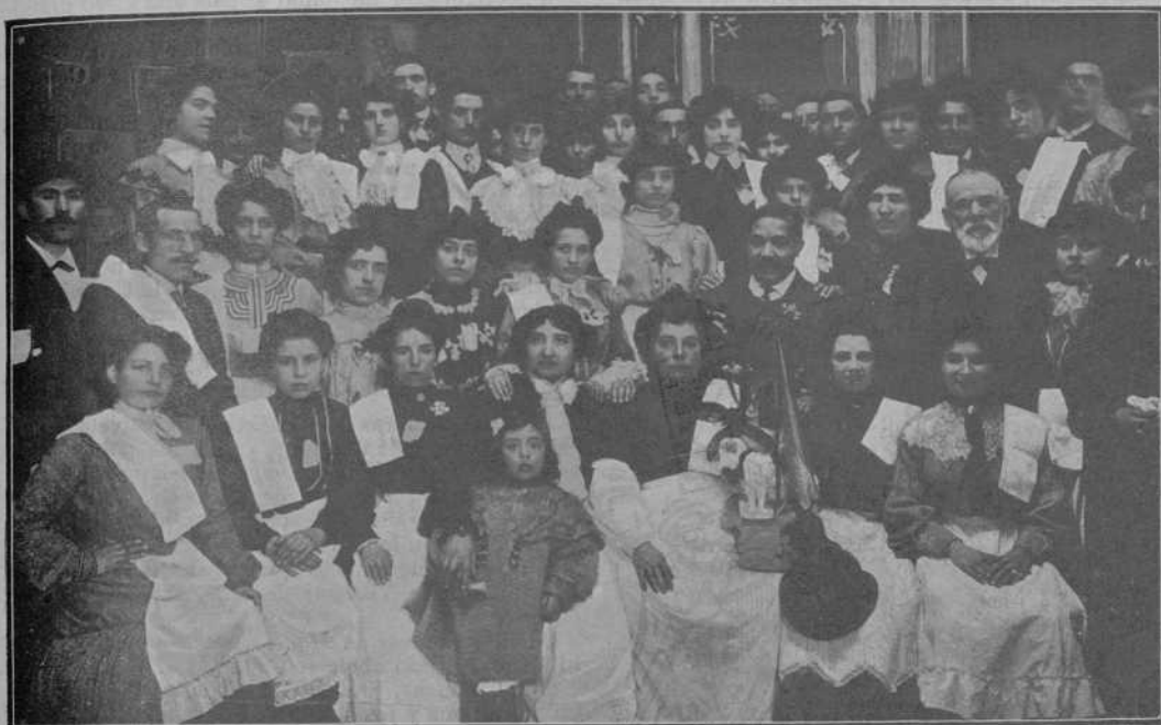
Grup de senyoretas que tingueren á son càrrech el servey del dinar.