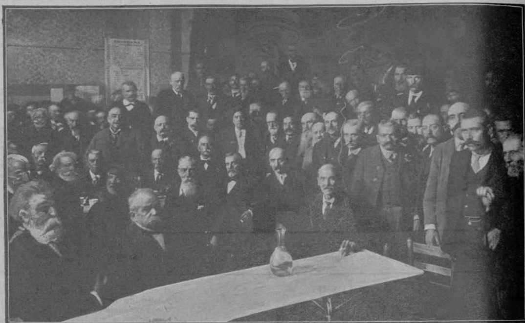
Els vells que 'l passat diumenge assistiren al banquet que 's donà a la "Fraternitat" en honor seu.

Més val aixís, per ell y per la empresa. Pel públich per que sempre es millor distreure's que aburrirse, y per la empresa per que en aquest temps no son de despreciar els éxits lògrinse com se logrin y conseguéixinse com se conseguixin.