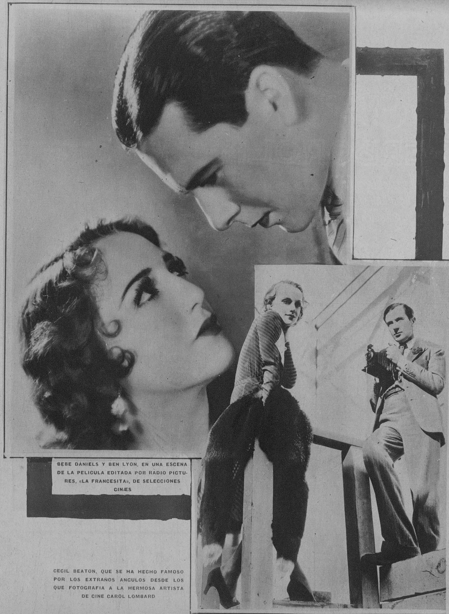
BEBE DANIELS Y BEN LYON, EN UNA ESCENA DE LA PELICULA EDITADA POR RADIO PICTURES, «LA FRANCESITA», DE SELECCIONES CINES