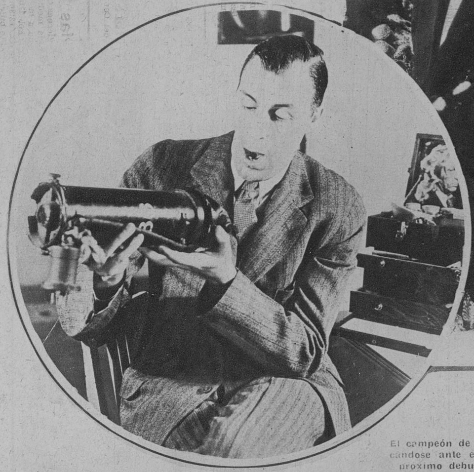
El campeón de tennis Tilden, practicándose ante el microfono para su proximo debut en el cine sonoro