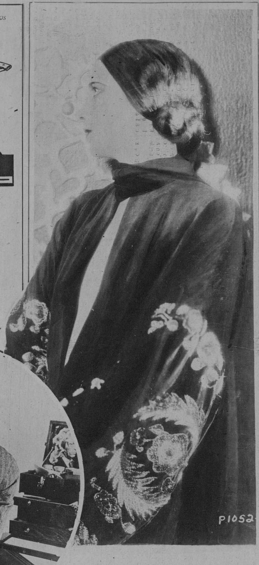
Kay Francis, notable artista de la pantalla