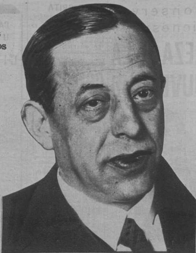
Don Agustín Viñuales, nuevo ministro de Hacienda