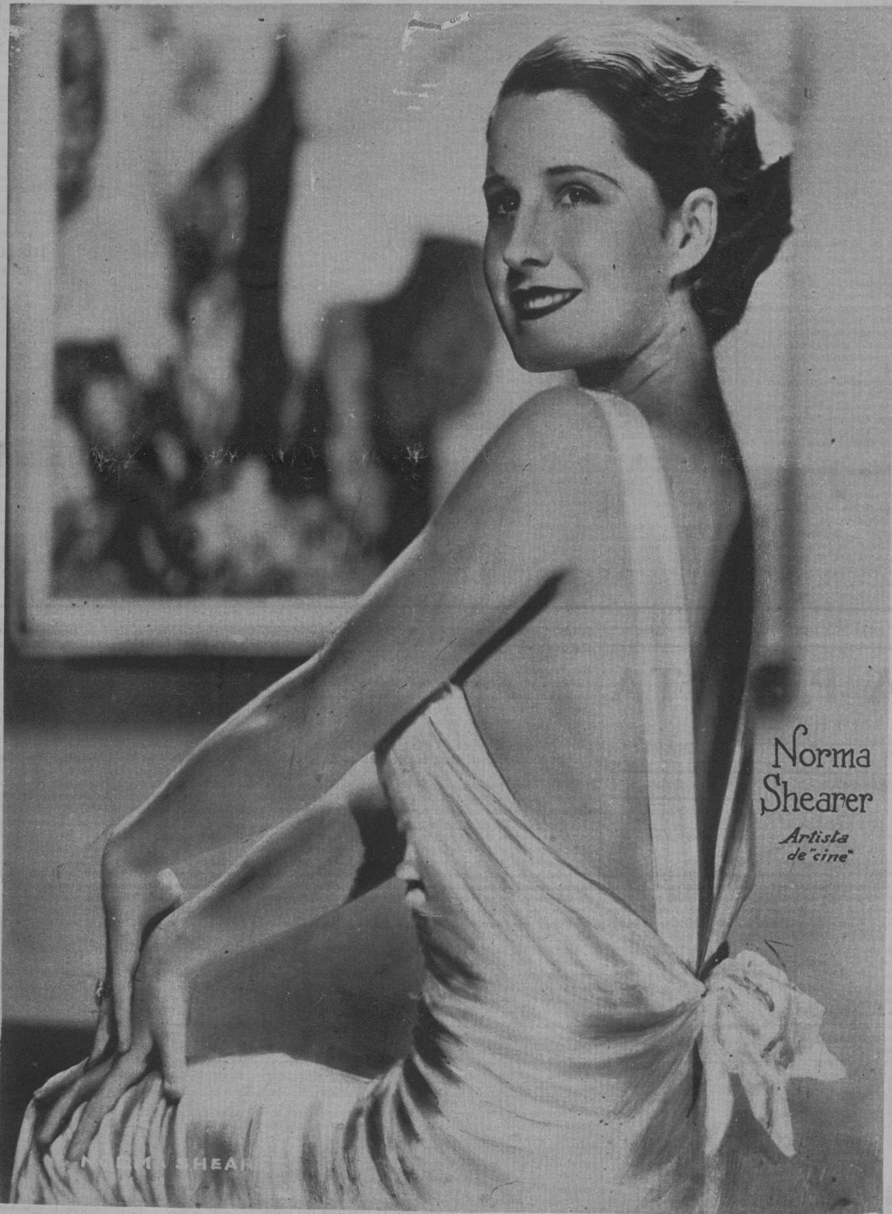
Norma Shearer Artista de "cine"