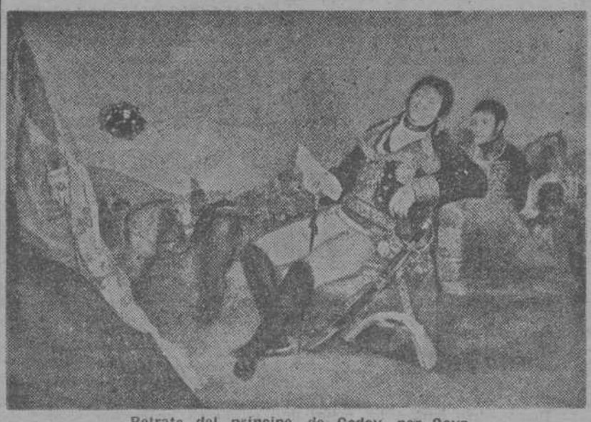
Retrato del príncipe de Godoy, por Goya

También el triunfo de Godoy fué, ante todo, el triunfo de una familia. Incluso sexualmente. La reina Ma- ría Luisa se enamoró primero de Luis Godoy, el hermano mayor, el primero que llegó a Madrid proceden- te de la casa nativa de Badajoz para servir en los guardias de Corps. El triunfo de Godoy fué tan familiar que resultó demasiado casero. En esto ya se diferencia de Napoleón; como la España de entonces, y toda- vía, aunque menos, la de hoy, se di- ferencia y se sigue diferenciando de