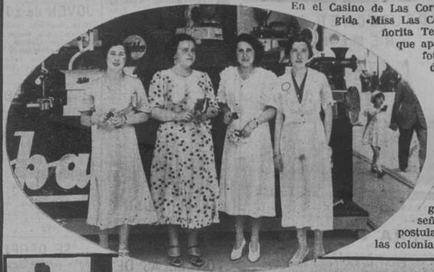
Mataró.— Uno de los grupos de señoritas que postularon para las colonias escolares