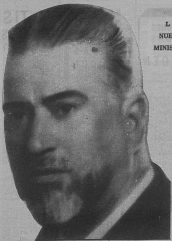
Don Francisco Barnés, ministro de Instrucción Pública