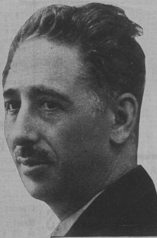
Don Luis Companys, nuevo ministro de Marina