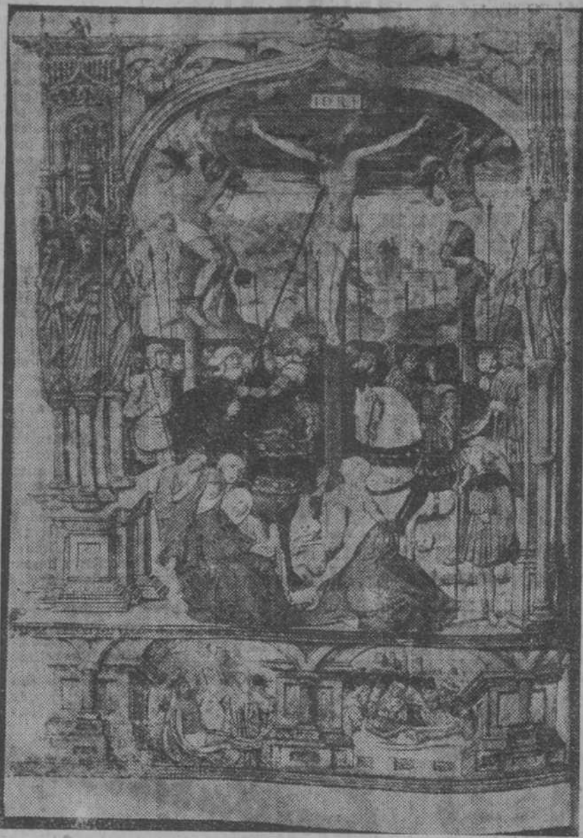
EL CALVARIO (Misal del Cardenal Hurtado de Mendoza. Siglo XV)

Nuevo, porque Jesucristo lo promulgó por vez primera; pero nuevo también y siempre reiterado, porque se cumple tarde o temprano, o no se cumple, aun por los mismos que se llaman por cristianos. Es el mandato específico del cristianismo. Lo que ha de distinguirnos de los demás hombres no es el rezar mucho, sino el amar un poco, con amor de caridad. Amor no sólo a los pobres, que eso es más fácil, sino al prójimo. Y el prójimo es todo aquel a quien podemos hacer un bien o evitar un mal. Hacerle ese bien, evitarle ese mal, eso es amar en cristiano. Lo demás será rezar. Pero rezar, rezan también los paganos a sus divinidades. "Donde hay caridad y amor—cantan las estrofas del "Mandato"—allí está Dios". Cuando entre los hombres veamos mucho mal y mucho dolor, es que allí falta amor de caridad y, por lo tanto, falta Dios.