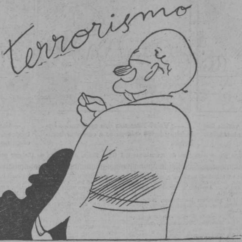
—Y ahora vamos a poner punto final.