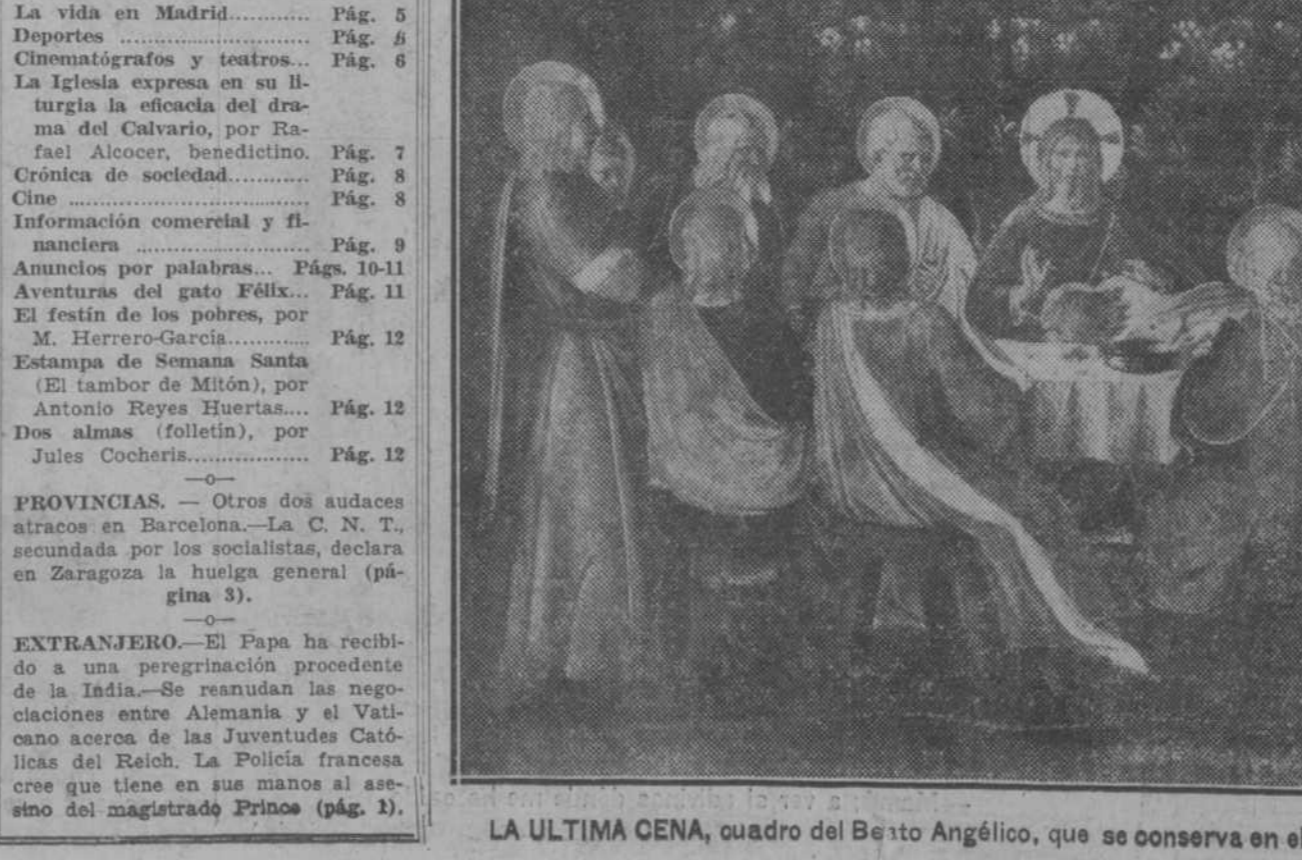
LA ULTIMA CENA, cuadro del Beato Angélico, que se conserva en el Museo de S. Marcos en Florencia

EXTRANJERO.—El Papa ha recibido a una peregrinación procedente de la India.—Se reanuda las negociaciones entre Alemania y el Vaticano acerca de las Juventudes Católicas del Reich. La Policía francesa cree que tiene en sus manos al asesino del magistrado Prince (pág. 1).