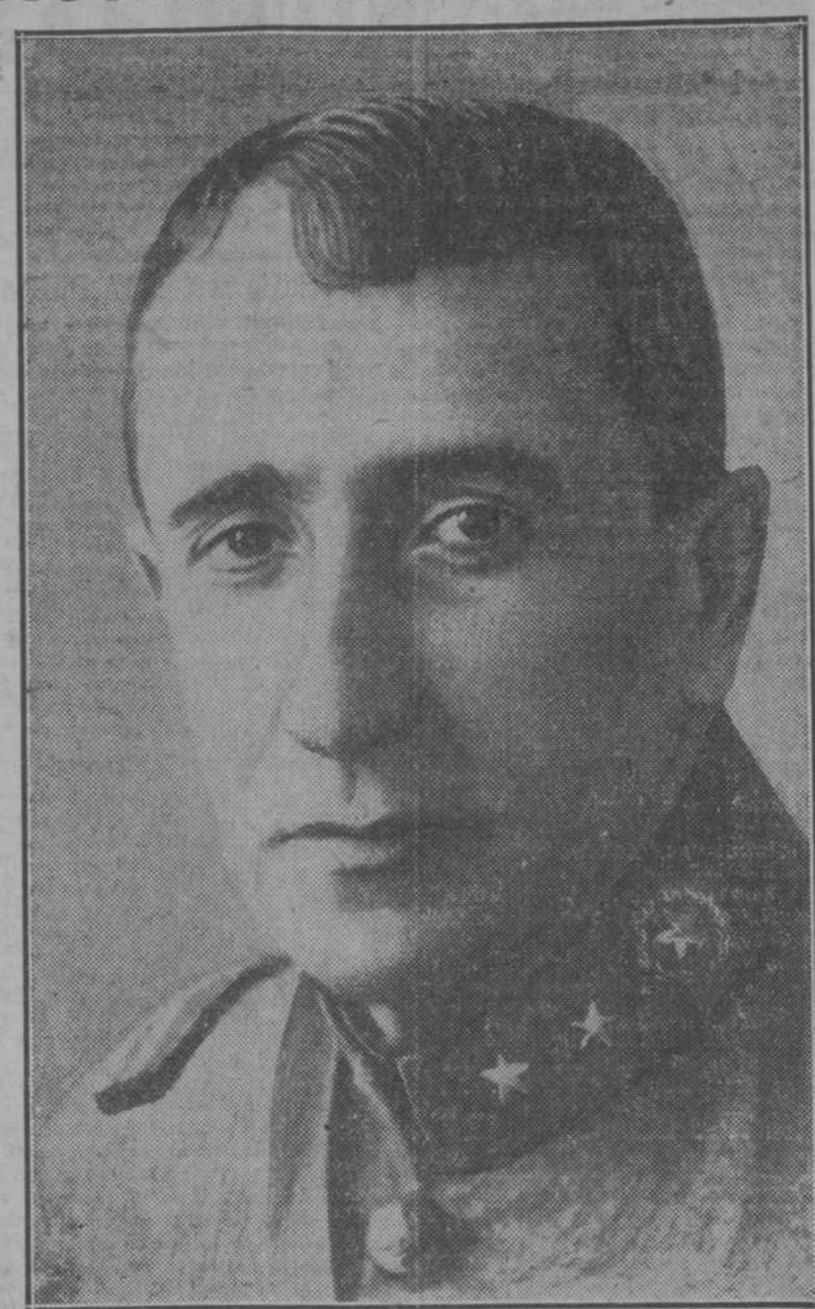
El Presidente de Guatemala, general Ubico, que ha convocado la Conferencia Centroamericana para iniciar una más estrecha unión entre las Repúblicas de América Central