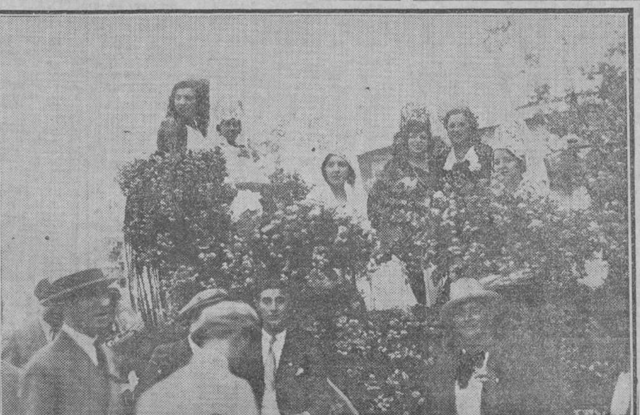
Las bellas señoritas que presidieron la becerrada benéfica de la Unión Artesana, en San Sebastián