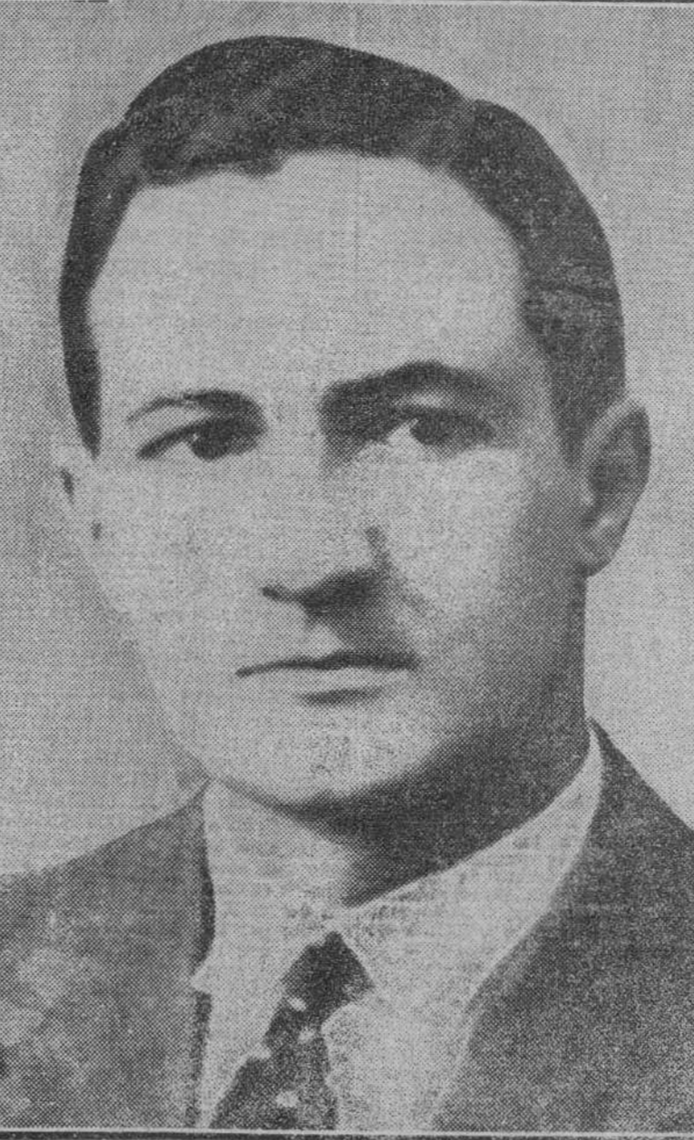
Don José Antonio de Aguirre y Lecube, alcalde de Guecho, alma de la Asamblea de los Municipios de Alava, Guipúzcoa, Vizcaya y Navarra, en la que se aprobó el Estatuto vasco

Don José Antonio de Aguirre y Lecube nació en el año 1904. Con sus veintiséis años es hoy una de las figuras políticas más destacadas del País Vasco. Aguirre ha sido el primer presidente de las Juventudes Católicas de Vizcaya. Sus dotes de organizador y su elevado espíritu constructivo han quedado bien patentes con el éxito de la Asamblea de los Municipios vascos y con su acertada intervención en Estella, donde supo hermanar ideales de distintos partidos políticos en pro de una unidad de acción que puede ser fructífera en todo el País vasco. Por iniciativa de los alcaldes de Muncada y Bermeo se prepara al señor Aguirre un homenaje popular.