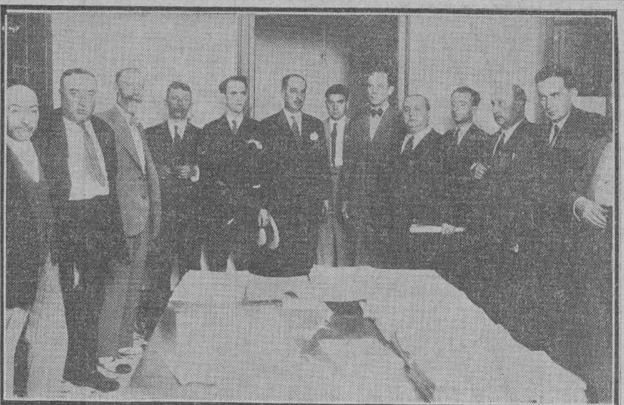
La Junta directiva y los delegados de distrito, que asistieron a la inauguración del Círculo de Acción Nacional en Córdoba

En un solo número de "El Socialista" hay flora y fauna abundantes para varios parques zoológicos y de aclimatación. Vamos a seleccionar algunas de estas especies.