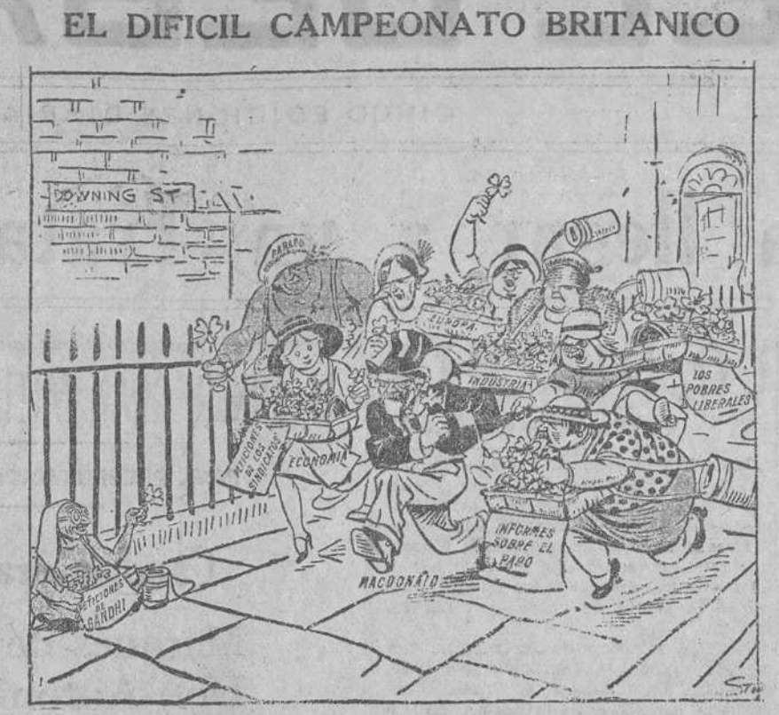
"A-a-a-nda e-e-on e-el 'Rrr-r-r-amsay!'"