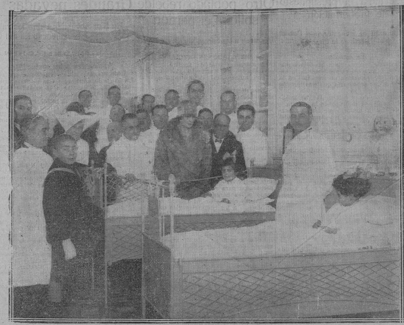
Su majestad doña Victoria recorriendo las salas del Hospital del Niño Jesús, después del reparto de juguetes a los niños allí recogidos