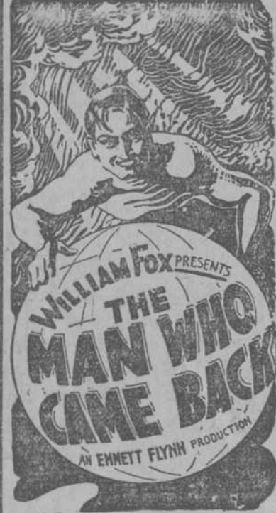
WILLIAM FOX PRESENTS THE MAN WHO CAME BACK AN ENNETT FLYNN PRODUCTION

UN PRECIPICIO ENORME. Es lo que se antepone al paso de la juventud cuando sin freno se lanza solo en pos de desconocidos caminos. GEORGE O'BRIEN (el de la eterna sonrisa) es un joven de figura varonil con una atracción en sus modales que cuando sea conocido por el alegre juventud cubano lo convertirá en su ídolo, como en todo el territorio de la Unión Americana. DEL ABISMO A LA CUMBRE es podemos decirlo con satisfacción una de las mejores películas FOX en donde se destacan los altísimos más insondables de una sociedad corrompida y por ello todo el mundo, debe de verla desde el joven hasta el viejo y desde su estreno será un gran acontecimiento social siendo desde el dos hasta el ocho de Enero en el cine