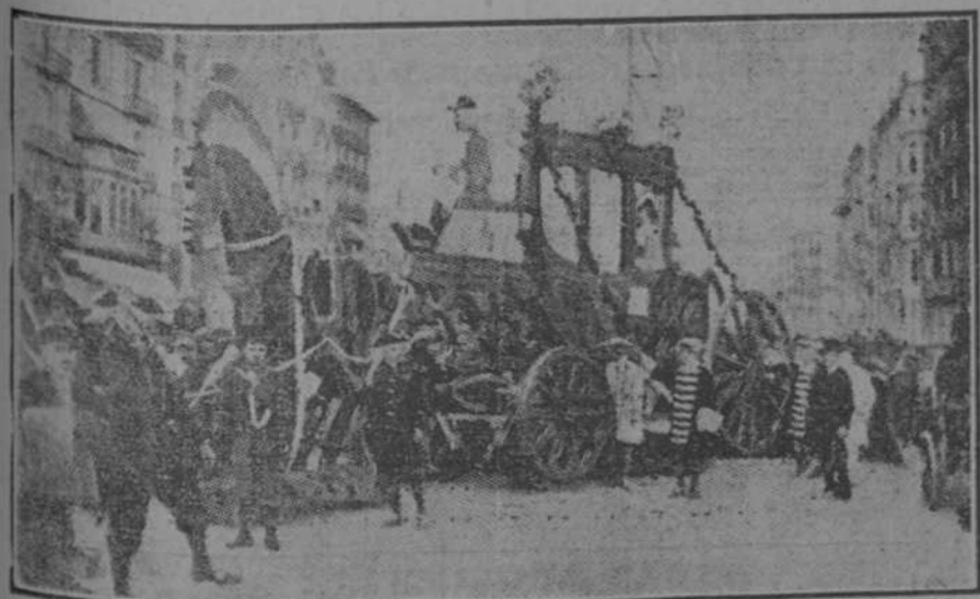
EL CARNAVAL EN BARCELONA.—Carroza Luis XV notable carro presentado por "El Niu Guerrer," que obtuvo el premio de 1500 pesetas. Representaba una carroza antigua arrastrada por cinco caballos, una y otros de madera y tallados en plano, imitando el dibujo característico de las antiguas aleluyas. La figurada carroza descansaba sobre el chasis de un auto.

A las diez de la mañana de hoy les dos enfermos reclusos en el Sanatorio "Covadonga," Riguera y Escandón.