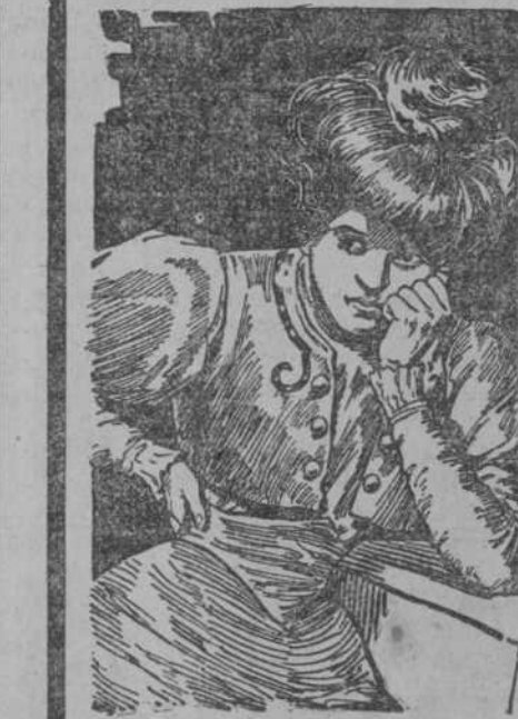
"Cada Cuadro Habla por Si."

Millares de mujeres de todas edades y condiciones sucumben y son víctimas de un penoso estado de postración debido á que tienen afectados los riñones y no lo saben. Se consume la vitalidad, se destruyen los nervios y se hacen imposibles el descanso, sueño y desempeño de los quehaceres domésticos.